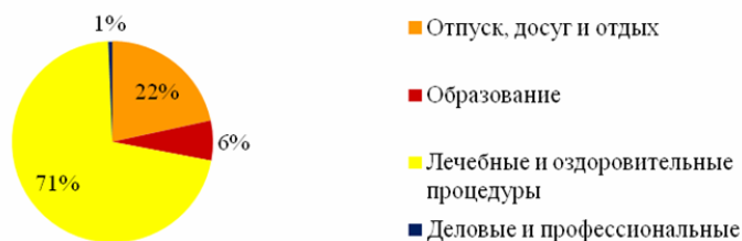
Рис. 3. Основные цели визита граждан в санатории Калининградской области, 2012 год [5]

2) Большая часть посетителей санаториев Калининградской области (в 2012 году 46108 человек или 71,17%) основной целью пребывания назвали «лечебные и оздоровительные процедуры», в то время как «отпуск, досуг и отдых» выбрали 13949 (21,17%) [5], рис.3.