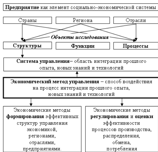
Рис. 1. Экономический метод управления как основа социально-экономических реформ 4

В результате мы получаем возможность взглянуть на предприятие как структурный элемент макроэкономических систем и как объект управляющего воздействия по результатам функционирования которого оценивается эффективность применяемых экономических методов управления. Также возможно раскрытие сущности предприятия, как микроэкономической системы, с точки зрения содержания её внутренних процессов, структур и подсистем, где используются соответствующие экономические методы управления, реализация которых зависит от всех участников бизнес-процессов.