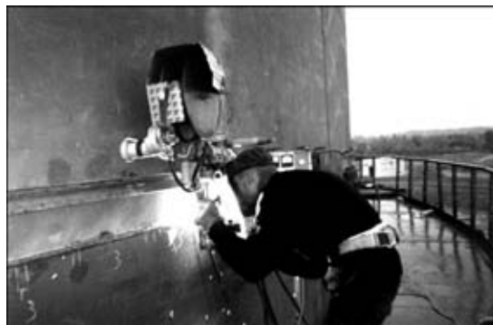
Выполнение сварки горизонтального шва

Контакты: 03680, Украина, Киев-150, ул. Боженко, 11 Институт электросварки им. Е. О. Патона НАН Украины Отд. № 37, тел./факс: (38044) 287 24 66