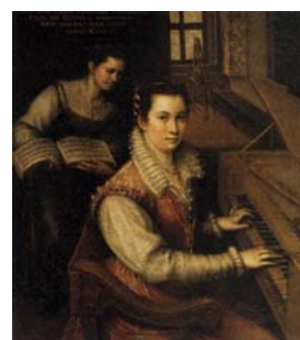
Рис. 3. Л. Фонтана «Автопортрет у спинета»