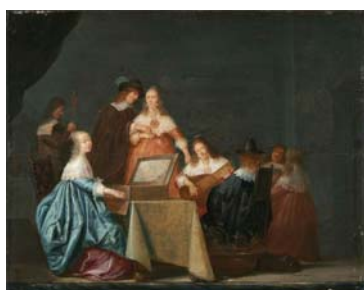
Рис. 7. Г. Кампер «Музыкальный вечер»