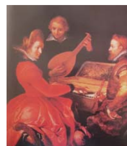
Рис. 9. М. Пепейн «Трио»