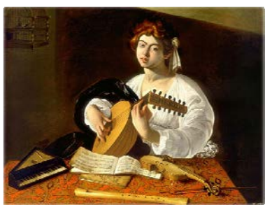
Рис. 1. Караваджо «Лютнист»

Список картин эпохи барокко с представленными на них струнными клавишными инструментами можно было бы продолжить. Все они помогают определить те или иные атрибутивные признаки исследуемого вида культурных ценностей, и таким образом, становятся существенным дополнительным источником таможенной идентификации. К дальнейшим исследованиям в этом направлении могут привлекаться разнообразные произведения живописи, реалистически воссоздающие различные виды культурных ценностей.