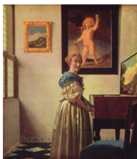
Рис. 5. Я. Вермеер «Молодая женщина, стоящая за вёрджинелом»