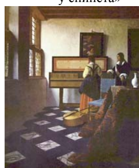
Рис. 6. Я. Вермеер «Урок музыки»