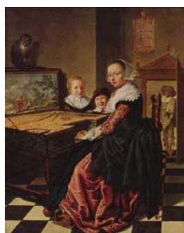
Рис. 8. Я. Моленар «Вёрджинел»