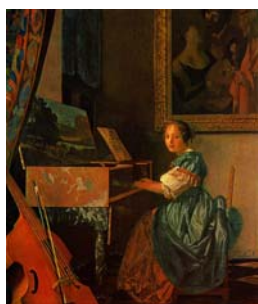
Рис. 4. Я. Вермеер «Молодая женщина, сидящая за вёрджинелом»