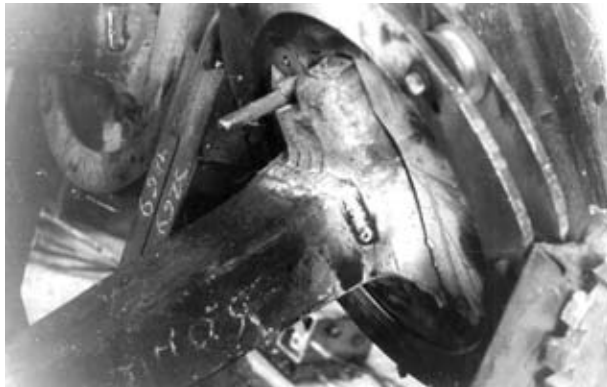
Заваренная трещина в корпусе автосцепки в месте перехода хвостовика к головке