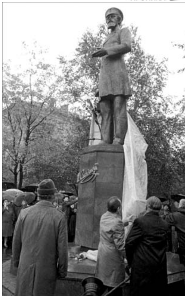
Открытие памятника Н. Г. Славянову. Пермь, 14 сентября 1988 г.

К началу XX в. применение сварки по способу Славянова сильно сократилось. Объясняется это в первую очередь сложностью (по тем временам) техники выполнения сварки. Попытки упростить способ, исключить некоторые операции приводили к резкому ухудшению качества соединения. Однако уже в первом десятилетии XX в. получила развитие идея сварки металлическим электродом, сначала без покрытия, а затем и со стабилизирующими и легирующими покрытиями (А. Стромберг, О. Кьельберг и др.). Продолжалось совершенствование генераторов. К концу 1930-х гг. исследователи вернулись к идее Н. Г. Славянова защищать зону сварки насыпным флюсом, а электрод подавать без покрытия. Высоких результатов достигли в США (фирма «Линде», Г. Э.