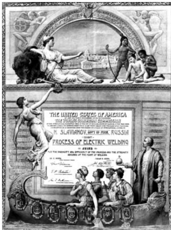
Грамота Всемирной Колумбийской выставки (1893, США), которой отмечен вклад Н. Г. Славянова в создание электросварки