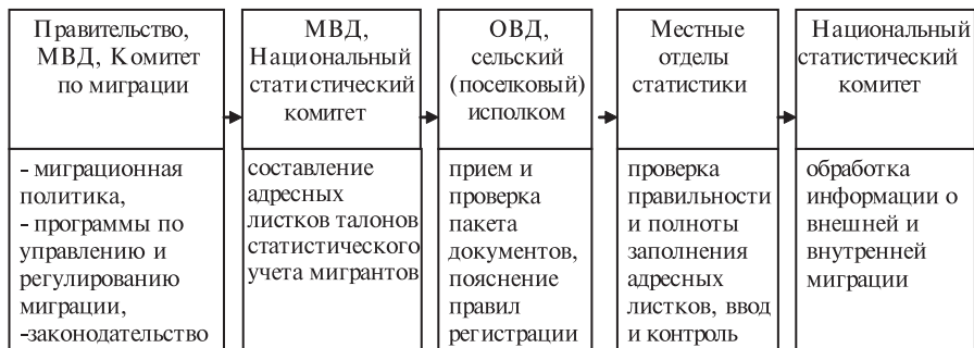
Рис. 1. Схема миграционного учета населения в Республике Беларусь

Миграционный учет в Республике построен по следующей схеме, которая позволяет наглядно представить порядок регистрации мигрантов (рис. 1).