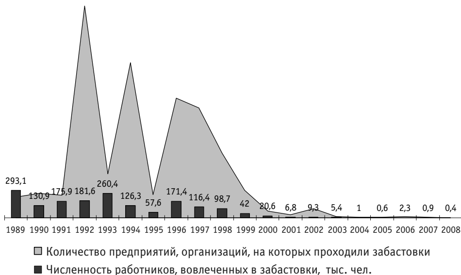
Рис. 1. Динамика забастовочного движения в 1989–2008 годах, %

Динамика уровня рабочего движения. Панораму забастовочной активности в независимой Украине рассмотрим сначала на основе данных официальной статистики 1 . С 1995 года Госкомстат Украины фиксирует данные о забастовочном движении согласно требованиям Международной организации труда, в частности такие рубрики: число предприятий, на которых проходили забастовки (статистика дается без учета малых предприятий), численность их участников (как вовлеченных в забастовки в целом, так и в расчете на одно предприятие), а также количество неотработанных дней в среднем на одного бастующего.