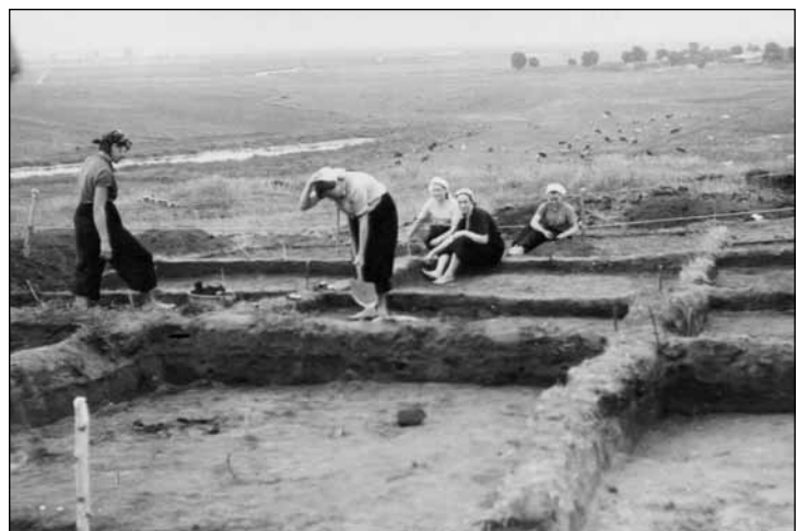
Раскопки городища Круглица. Рабочий момент.

Раскопки Л.И. Пимакина на городище Круглица можно сказать опередили свое время. Так как предложенная им методика,