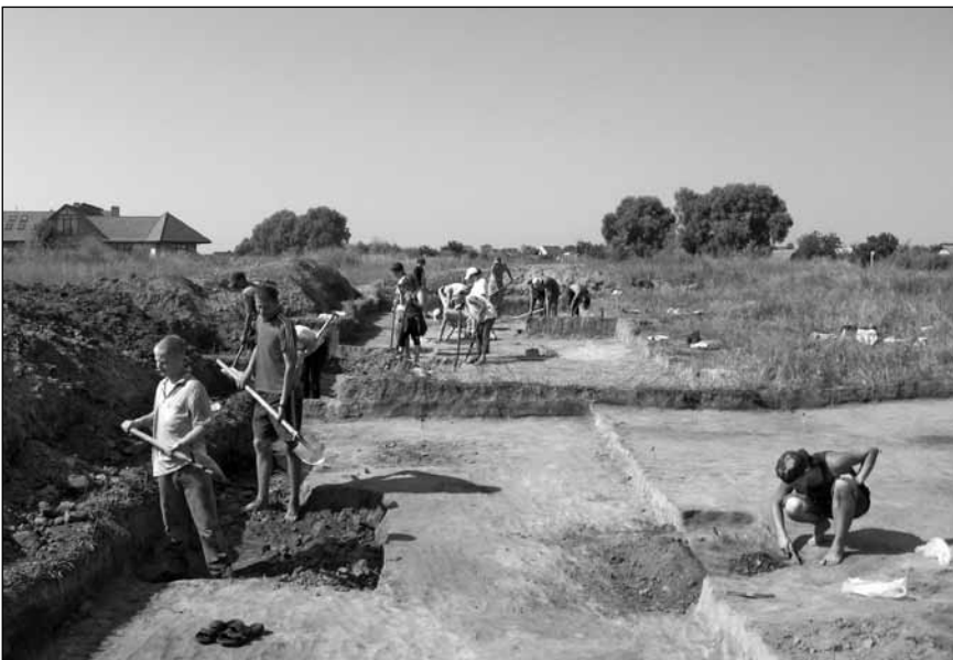
Дослідження культурних нашарувань розкопу студентами під час археологічної практики

В результаті практики на Ходосівському археологічному комплексі студенти знайомляться з основними різновидами польових досліджень (розвідки та розкопки) різних типів археологічних пам'яток; опановують методи розбивання розкопів (шурфів, траншей) та специфіку проведення земляних робіт на різних типах археологічних пам'яток; засвоюють навички дослідження культурного шару та заповнення об'єктів (будівель, господарчих ям, тощо) (Див. фото внизу на с. 158); знайомляться на практиці зі способами фіксації археологічного