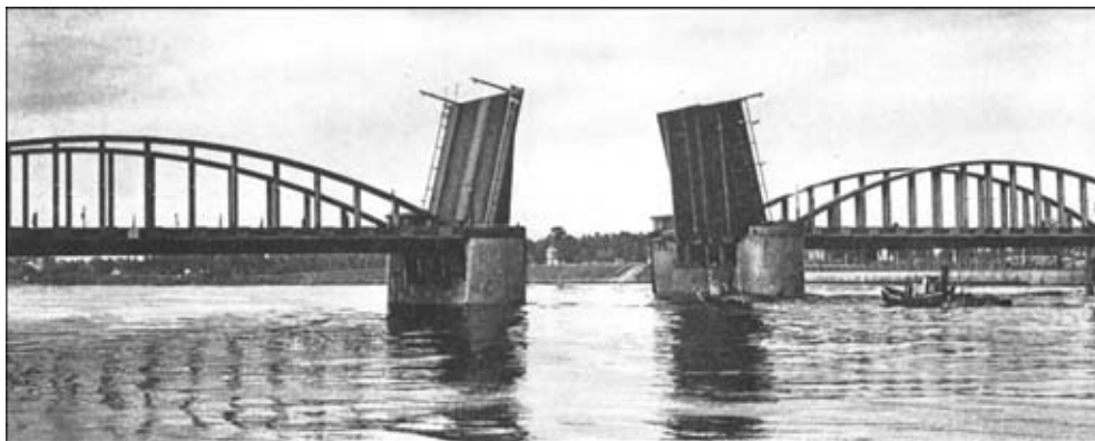
Рис. 3. Володарский мост через Неву