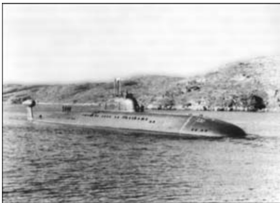
Рис. 5. Атомная подводная лодка (проект 671РТМК), построенная в Адмиралтейском объединении

паровых и газовых турбин, а также другого энергетического оборудования из специальных сталей, титана, циркония. В 1960–1970 гг. здесь продолжался выпуск тракторов («Кировец»), танков (Т-80), ракетно-зенитных комплексов.