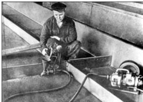
Рис. 7. Сварка корабельных конструкций полуавто- матом ПШ-5 (г. Ленинград, 1950)