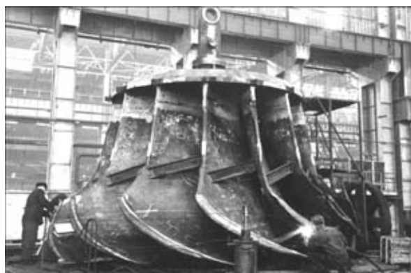
Рис. 8. Подготовка к ЭШС колеса гидротурбины для Асуан- ской ГЭС на Ленинградском металлическом заводе (1965)