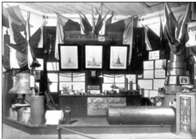
Рис. 1. Экспозиция Бенардоса на IV Всероссийской электрической выставке (Санкт-Петербург, 1892)