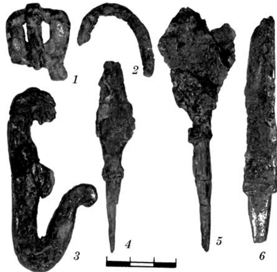
Рис. 3. Могильник біля с. Ходорів, вироби з заліза: 1 — пряжка; 2 — кільце; 3 — кресало; 4, 5 — наконечники стріл; 6 — ніж

Для з'єднання деталей користувались невеликими, добре загостреними шпильками, круглими в перетині, діаметром верхньої частини 3 мм, довжиною 1,7 см (рис. 2, 4).