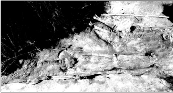
Рис. 1. Могильник біля с. Ходорів. Поховання № 1.

подібні речі знайдено в кургані печенізької групи № 250 пох. 4 поблизу с. Цозарівка Кагарлицького р-ну (разом з боковою типу 3.2, яка, у свою чергу, має аналогії в Саркелі — Білій Вежі IX—XI ст. та саблею першої половини XII ст.) (Плетнева 1973, табл. 22, 2), Саркелі — Білій Вежі IX—XI ст., Новоніколаївському могильнику X—XI ст., відкритих комплексах Канева — X—XII ст., хут. Половецького X—XIII ст., загалом існуючи до XIV ст., (Медведев 1966, с. 36—40).