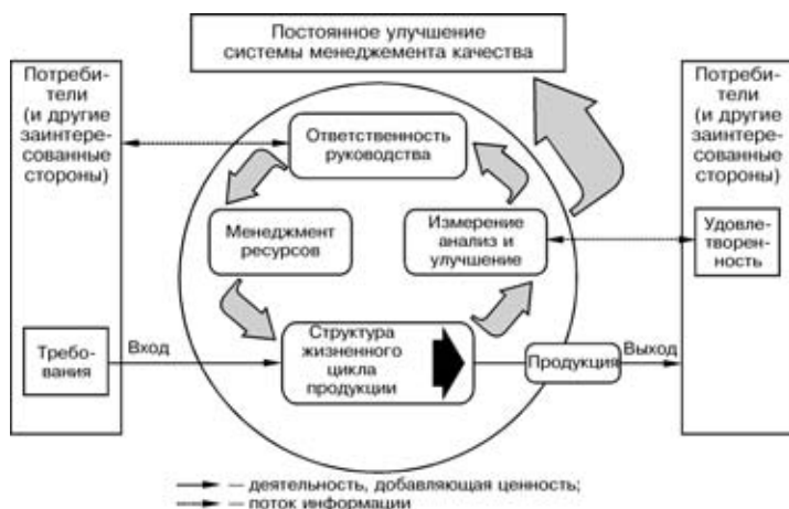
Рис. 1. Модель системы менеджмента качества, основанная на процессном подходе

исполнителей заказов столь ответственных потребителей — очень заманчивая перспектива для любого предприятия.