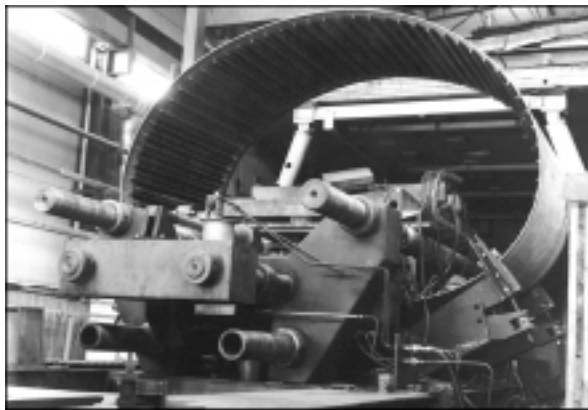
Сварная стрингерная оболочка в процессе изготовления (диаметр оболочки 4000 мм, длина 2200 мм, толщина обшивки 5 мм, 72 ребра жесткости приварены к обшивке с применением электроно-лучевой сварки)