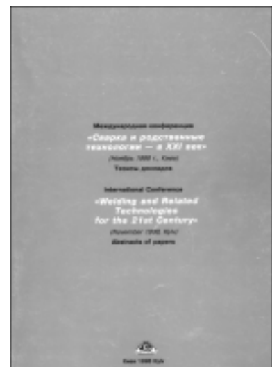
Материалы международных конференций