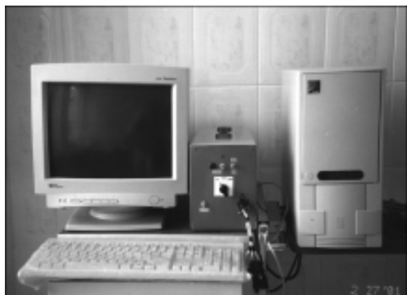
Сварочный комплекс для соединения мягких живых тканей

алисты из Беларуси, России, Венгрии, Польши, Словакии, Чехии, Болгарии, Узбекистана, Германии, Франции, Румынии, Японии, США, Кореи, Китая, Украины. Среди проведенных конференций следует отметить такие крупные, как «Сварка и родственные технологии в XXI век» (ноябрь 1998 г., г. Киев), «Сварные конструкции» (октябрь 2000 г., г. Киев).