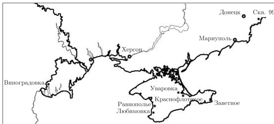
Рис. 1. Схема расположения обнажений и скважин с комплексами понтических остракод

Нижний региоподъярус. Восточное Приазовье. В скв. № 99 (бассейн р. Грузский Еланчик) в нижней части интервала 16,5–18,0 м в глине буровато-зеленой с охристыми пятнами раннепонтические остракоды представлены видами: Candona (Pontoniella) loczyi (Zalanyi); Loxocorniculina djaffarovi Schneider. А в верхней его части (16,0–16,5 м) (известняк белый с охристыми пятнами) встречены: Candona (Pontoniella) acumi-