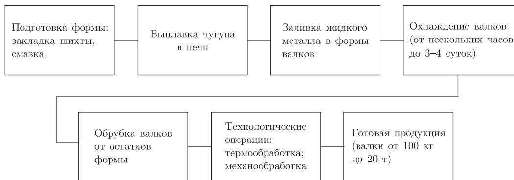
Рис. 1. Принципиальная схема технологии производства чугунных валков

Постановка задачи исследования. Для периодического технологического процесса до начала реализации его основного цикла с учетом возможных изменений качества исходного материала требуется разработать метод прогнозирования допустимо точных значений показателей качества целевого продукта.