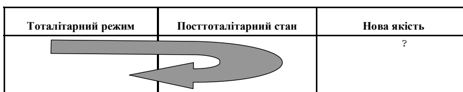
Модель зворотного розвитку