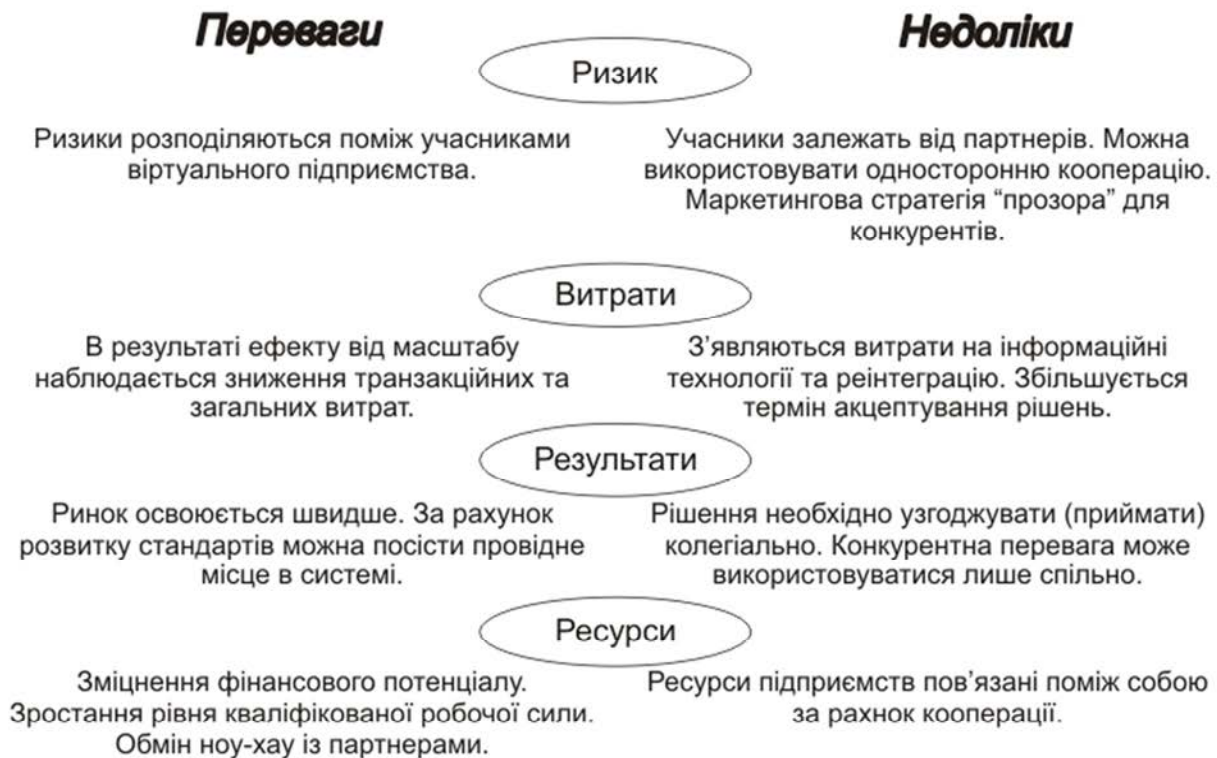
Рис. 1. Показники переваг та недоліків віртуального підприємства

ція не тільки сприяє розподіленню ризиків між учасниками ланцюга виробництва (обслуговування) та зниженню невизначеності, але і викликає створення нових ризиків пов'язаних з взаємодією підприємств.