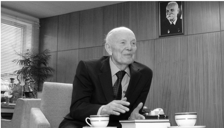
При съемке Б. Е. Патон непременно оказывался в кадре с портретом своего отца Е.О. Патона

Сейчас мы такие операции начинаем в Китае, и китайцы проявляют к ним большой интерес. Если вспом-