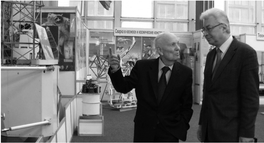
Академик Б.Е. Патон лично провел подробную экскурсию по музею института

и Луну не забывал. Так что в космосе мы все-таки поработали. И, кроме того, мы сильно расширили круг материалов, на которых проводятся сварочные работы. Начиналось с металла: сталь, цветные металлы, композиционные материалы, а теперь мы работаем уже над сваркой живых тканей, и все больше пациентов, прошедших через руки замечательных хирургов, которые освоили сварку живого. Таких хирургов насчитывается уже много, и в первую очередь в Украине, потому что эта сварка здесь зародилась.