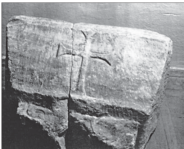
Капітель із Десятинної церкви