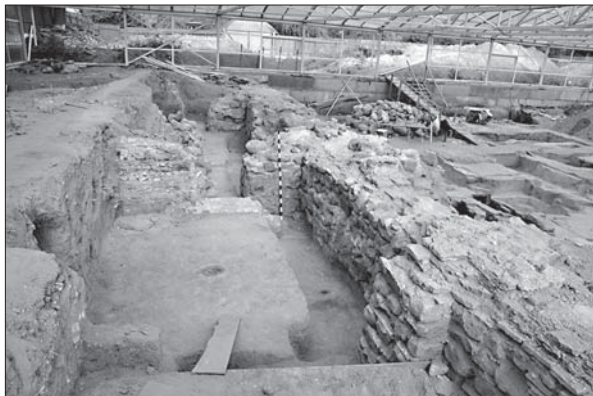
Розкопки Десятинної церкви експедицією чл.-кор. НАН України Г.Ю. Івакіна