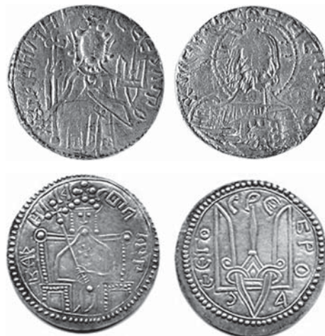
Срібники і златники часів Володимира з написами «Владимир на столе, а се его злато» і «Владимир на столе, а се его сребро»

человеков». Власне кажучи, йшлося про спосіб життя, оснований на традиціях візантійського християнства, де вже були чіткі закони, і це мало велике значення. По суті Володимир Святославович зробив цивілізаційний вибір на наступне тисячоліття. І коли я чую від попе-