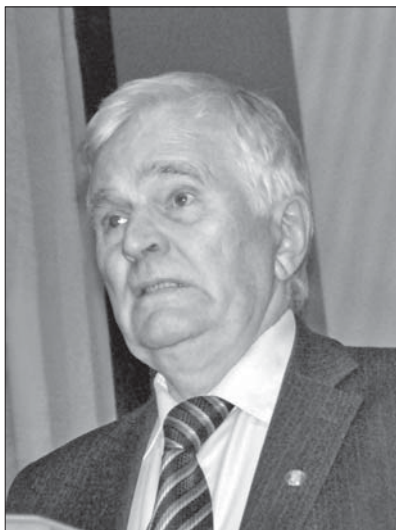
ТОЛОЧКО Петро Петрович — академік НАН України, директор Інституту археології НАН України