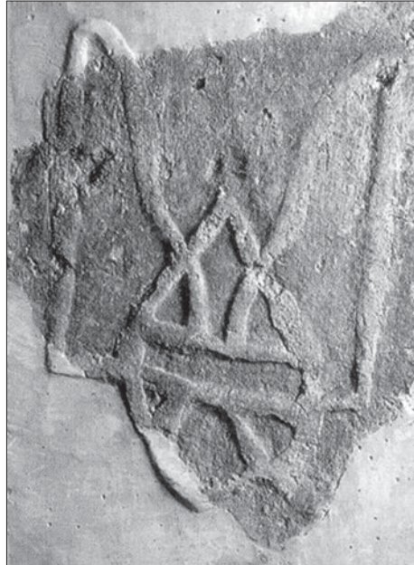
Плінфа з Десятинної церкви з князівським знаком Володимира

Прийняття віри для Володимира було не стільки явищем віросповідання, скільки явищем законотворчим. Він здобував закон для своєї країни. І коли до нього приходили гінці-місіонери з різних країн, він найперше питав: «Что есть закон ваш?». Не «что есть вера ваша», а «что есть закон ваш». Коли Володимир вирішував, чи прийняти візантійське православ'я, йому казали, що якби був поганій закон візантійський, то «не приняла бы его бабка твоя Ольга, а она была мудрейшая из всех