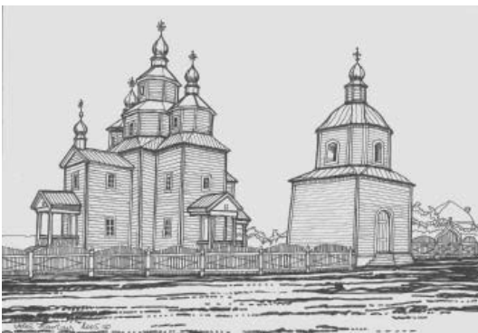
Зовнішній вигляд церкви та дзвіниці після оновлення 1818 р. з північного заходу. Прорис автора.

Першу постійну дерев'яну церкву в ім'я Архангела Михаїла з дозволу та благословення Київського, Галицького і Малої Росії Тимофія Щербачького було збудовано у Старому Кодаку в