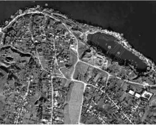
Місце локалізації фортець Старого Кодака і слобід за мапами XVII–XIX ст. Червоним хрестиком показано місце знайдення решток церковної споруди Старого Кодака (прорис автора).

Місце локалізації фортець Старого Кодака і слобід за мапами XVII–XIX ст. Червоним хрестиком показано місце знайдення решток церковної споруди Старого Кодака (прорис автора). По-перше, напрямку проходять сучасні вул. Червоноармійська та Горького. То яка з них? По-друге, на мапі вказано невеличкий вибалок, що теж прямує майже з півдня на північ. Таких на сьогодні теж два. Один проходить повз житловий квартал між вул. Червоноармійською та Горького, другий – повз цвинтар і забудовою непарної сторони вул. Горького. Який із вибалків?