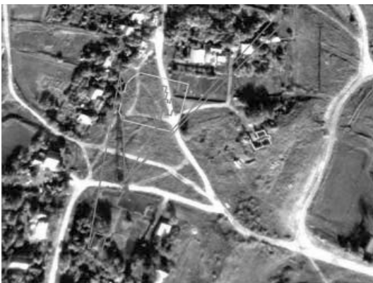
Місце локалізації церковної садиби, церкви та дзвіниці, напрямки зорового сприйняття за ілюстраціями 2 та 6. Червоним наведено житлові будівлі, за допомогою яких віднайдено місце зорового сприйняття церковного комплексу. (прорис автора).

Численні експедиції до колишньої фортеці та поселення, вивчення ландшафту не давали ніяких результатів. Ніяких решток, ніяких значних пагорбів, ніяких історичних споруд у цьому секторі не траплялося, тобто нічо-