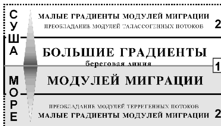
Рис. 1. Строение акваториально-территориальной системы (составлен по описанию из [3]):

А.В. Дроздов выделял в строении АТС две зоны: осевую прибрежную и периферическую, каждая из которых представлена ее водной и сухопутной частями (рис. 1). В осевой прибрежной зоне большинство взаимодействий и основная часть переносов пространственно совмещены. При проведении границ зон автор [3] руководствовался качественно-количественным сопоставлением морских и сухопутных переносов. В соответствии с этим, границы осевой прибрежной зоны проводились там, где большие градиенты модулей миграции вещества сменяются малыми. Изменения градиентов подтверждаются рядом экспериментальных исследований [8–13]. По всей видимости, положение осевой прибрежной зоны АТС совпадает с границами самой береговой зоны. Границы периферической зоны имеют вид более-менее широкой полосы и выявляются по преобладанию модулей терригенных потоков в водной части системы и талассогенных – в сухопутной. Строение АТС А.В. Дроздова имеет много общего с нуклеарными геосистемами А.Ю. Ретеюма [14], в строении которых тоже выделяются центральная и периферическая части, а в центре или ядре, как и в осевой прибрежной зоне АТС, сосредоточены масса, энергия или информация, рассеивающиеся к периферии.