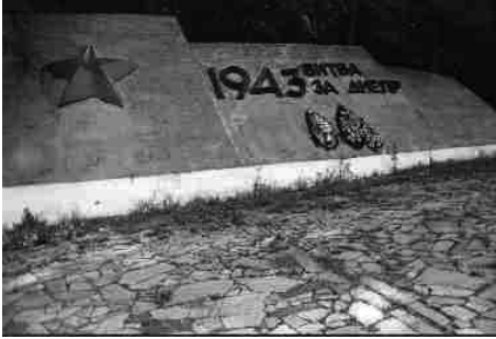
Пам'ятний знак при вході до меморіалу.

декілька разів переходили з одних рук до інших.