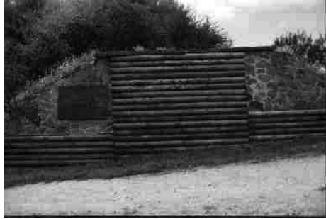
Пам'яткоохоронний знак давньоруського городища Чучин на території меморіалу.

У другій половині 21 вересня з партизанами 8-го з'єднання партизанських загонів ім. В.О. Чапаєва (командир І.К. Примак), який діяв із червня 1943 р. на ділянці між Ржищевим і Канєвим, зустрілися передові частини 69-ї гвардійської механізованої бригади 9-го механізованого корпусу. Наприкінці дня розпочалося форсування Дніпра. В ніч проти 22 вересня було зайня-