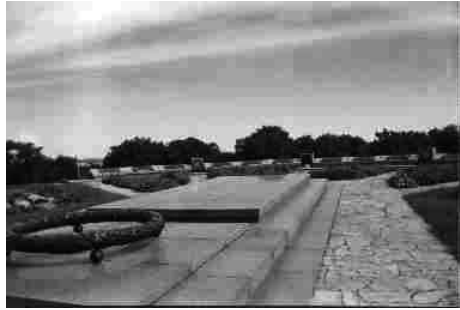
Фрагмент частини меморіалу з чашею вічного вогню.

З метою поліпшення відвідання меморіального комплексу з Києва необхідно налагодити регулярне автобусне сполучення із с. Балико-Щучинка. Можна було б організувати одноденну екскурсійну поїздку з одночасним відвідуванням Національного музею-заповідника «Битва за Київ у 1943 р.» у с. Ново-Петрівці Вишгородського району та Букринського плацдарму.