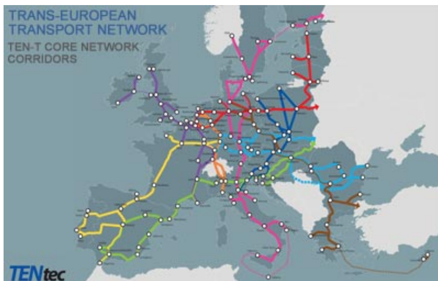
Fig. 1. Trans-European transport network

Development of the EU maritime transport aimed at modernizing infrastructure, the harmonization of equipment and procedures, improving safety measures at sea and protection of the marine environment. The main tasks of maritime policy are to improve the competitiveness and sustainability of the sector; reducing greenhouse gas emissions from international shipping; improving the quality of the environment in marine waters; management of waste and dismantling of ships; reduction of sulfur oxides and nitrogen oxides from the courts; promoting greater environmental navigation. Improve oversight of vessels navigating within or near its waters, introducing integrated information management system in accordance with the initiative of e-maritime; create an integrated, cross-border and cross-sectoral surveillance system.