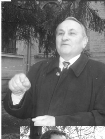
Виступає президент Української Астрономіч- ної асоціації академік Я.Яцків