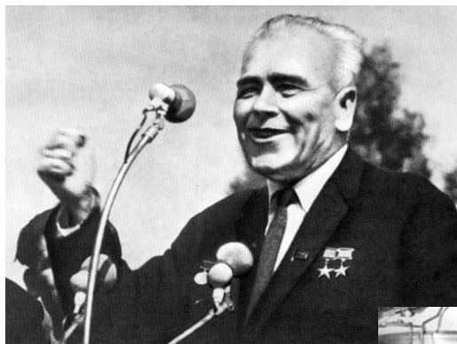
Виступ на 25-річному ювілеї КБ «Південне» (1969 р.)