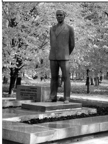
Завжди в строю. Памятник М.К. Янгелю в м. Дніпропетровську