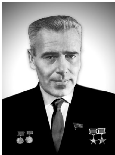
Генеральний конструктор Михайло Кузьмич ЯНГЕЛЬ