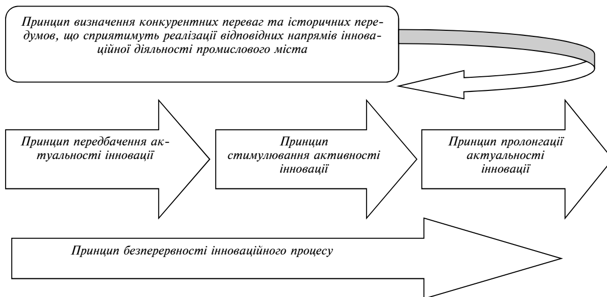
Рис. 2. Специфічні принципи забезпечення активізації інноваційного розвитку промислового міста

безперервності інноваційного процесу – передбачає максимальне скорочення часових проміжків між його етапами, постійне відтворення самих етапів НДДКР. Ефективне управління інноваційними процесами неможливе без урахування циклічності останніх [17, с. 50].