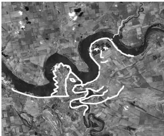
Рис. 2. Місцевість на річці Південний Буг з притокою Інгул