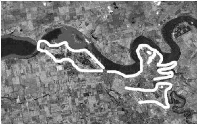
Рис. 3 Місцевість на річці Південний Буг поблизу Миколаєва

державності, за якої могла йти інтенсивна ротація еліти з політичним переписуванням історії і традицій, як це було в Польщі чи Росії. Крім того Святослава відносять до партії язичників, противників християн. Відомо, що його мати княгиня Ольга прийняла християнство, а Святослав розвалив побудовані нею церкви, бо визнавав культ Перуна і Велеса.