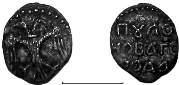
Рис. 1. Новгородське пуло з посаду Богородицької фортеці.