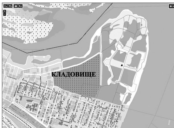
Рис. 3. Сучасні межі цвинтаря.

Завдяки сприянню низки небайдужих людей, за останні півтора роки пощастило знайти і викупити рештки цікавих знахідок, передусім це стосується нумізматики і ставрографії – всього понад 680 одиниць. Російська нумізматики представлена «лускою» від Івана Грозного до Петра I. Час правління Івана Грозного представлений 6-ма копійками й 15 монетами «деньга», Федора Іоановича – 3 копійками й 2 «деньгами», Бориса Годунова – 6 копійками, Михайла Федоровича – 5 копійками, Олексія Михайловича – 5 копійками. Найчисленніші знахідки пов'язані з петровською добою: 35 копійок окремих знахідок і рештки двох скарбів 54 й 48 копійок відповідно, причому перший скарб містив 500 монет у невеликому керамічному пошкодженому горщику. Європейських монет в окремих знахідках – більше 80 одиниць, в трьох скарбах – 50, 96 і 126 монет відповідно. При цьому місця знахідок називаються дуже приблизно. Натільних христів вдалося віднайти 146 примірників. З них приблизно в однаковій кількості барочних (жіночих) й чоловічих (простих прямих латинських), що, в цілому, відповідає співвідношенню в комплексах з інших територій [3; 8]. Ставрографічні матеріали зараз знаходяться в обробці для подальшої публікації, нумізматики чекає на свою чергу.