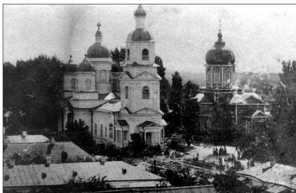
Рис. 1. Чигиринський Троїцький монастир. Праворуч – церква Пре- ображення Господнього. Фото 1911-1914 рр.