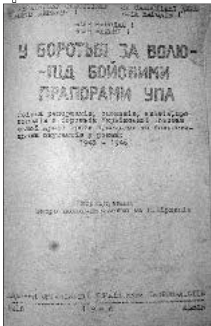
Обкладинка крайового видання збірки «У боротьбі за волю — під бойовими прапорами УПА». 1946 р.

переживань і цікавіших епізодів з життя в УПА поодиноких стрільців і командирів» 56 . Таку збірку під назвою «У боротьбі за волю — під бойовими прапорами УПА» було видано 1946 р. та влітку наступного року разом з іншими матеріалами доставлено вояками УПА до Західної Німеччини, де 1949 р. її було перевидано 57 . Наступними в окремому томі мали бути опубліковані матеріали про події на Закарпатті до серпня 1945 р., які складалися з близько 200 сторінок машинописного тексту та включали, зокрема, «багату статистику». Ці матеріали було зібрано та передано членам видавничого осередку підпільником на псевдо 'Володар' 58 восени 1946 р., однак плани щодо їх видання так і не були реалізовані 59 .