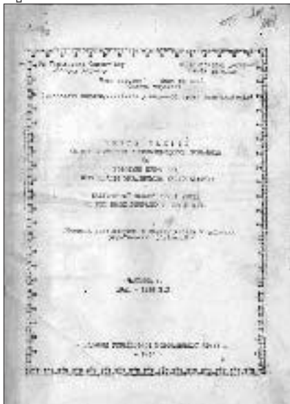
Титульний аркуш «Книги фактів»

словлював у післявоєнних спогадах сам Стецько 103 , хоча документальні джерела за липень 1941 р. й не подають конкретної інформації про замовників та виконавців цього злочину 104 .