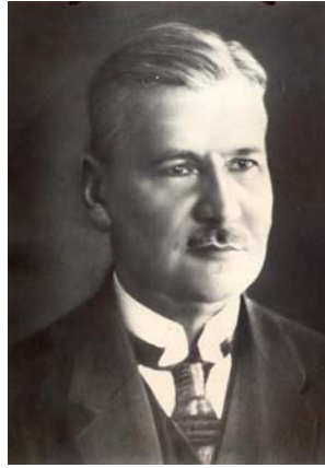
Рис. 4. Марцін Ернст.

для визначення часу, проводили спостереження планет і комет, зенітні спостереження зір для визначення широти методом Талькота, спостереження затемнень, покриття зір Місяцем, змінних зір, метеорів, нових зір, проходження Меркурія по диску Сонця тощо. М. Ернст двічі виїздив на спостереження повних сонячних затемнень: у 1905 р. до Іспанії та в 1914 р. – у Крим.