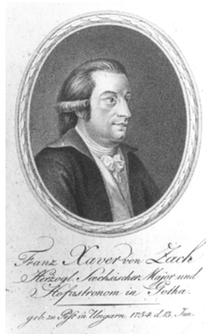
Рис. 3. Франц Ксавер фон Цах.

стереження Лісаніга та подробиці щодо топографічного знімання Галичини і Волині, яка прив'язувалася саме до Львівської обсерваторії. Наприкінці висловився так: “Ми закінчуємо тут із пристрасним бажанням, щоб патріотичні і доброзичливі пропозиції наших кореспондентів принесли сподівані результати. Пам'ять про великих людей, які свій вплив, свій авторитет і свої сили віддавали для поширення справді розумних і корисних знань і тим прислужитися людству не можуть ніколи загинути, їхні імена стоять записані на небосхилі незгасними чотами” .