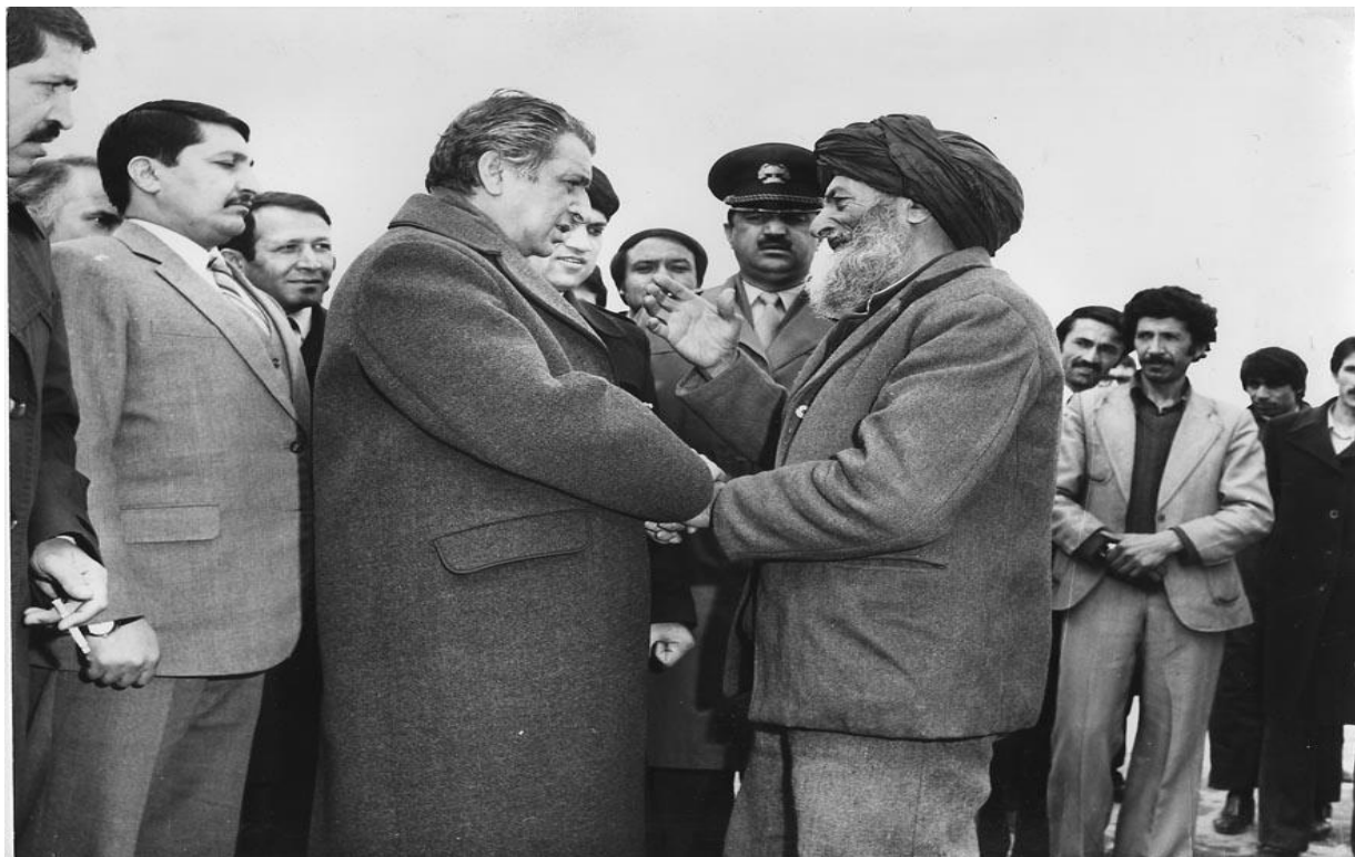
Кабул, 1983 г. Б.Кармаль беседует с рабочим авторемонтного завода «Джангалак»

С 3 по 7 марта 1981 года был проведен первый съезд афганских профсоюзов, знаменовавший собой завершение периода организационного становления этой массовой организации. В его работе приняли участие 500 делегатов из 27 провинций страны. На съезде в качестве гостей присутствовали 23 зарубежные делегации, в том числе и делегации Всемирной федерации профсоюзов и Всесоюзного центрального совета профессиональных союзов СССР. Съезд принял устав афганских профсоюзов и избрал новый состав их руководящих органов.