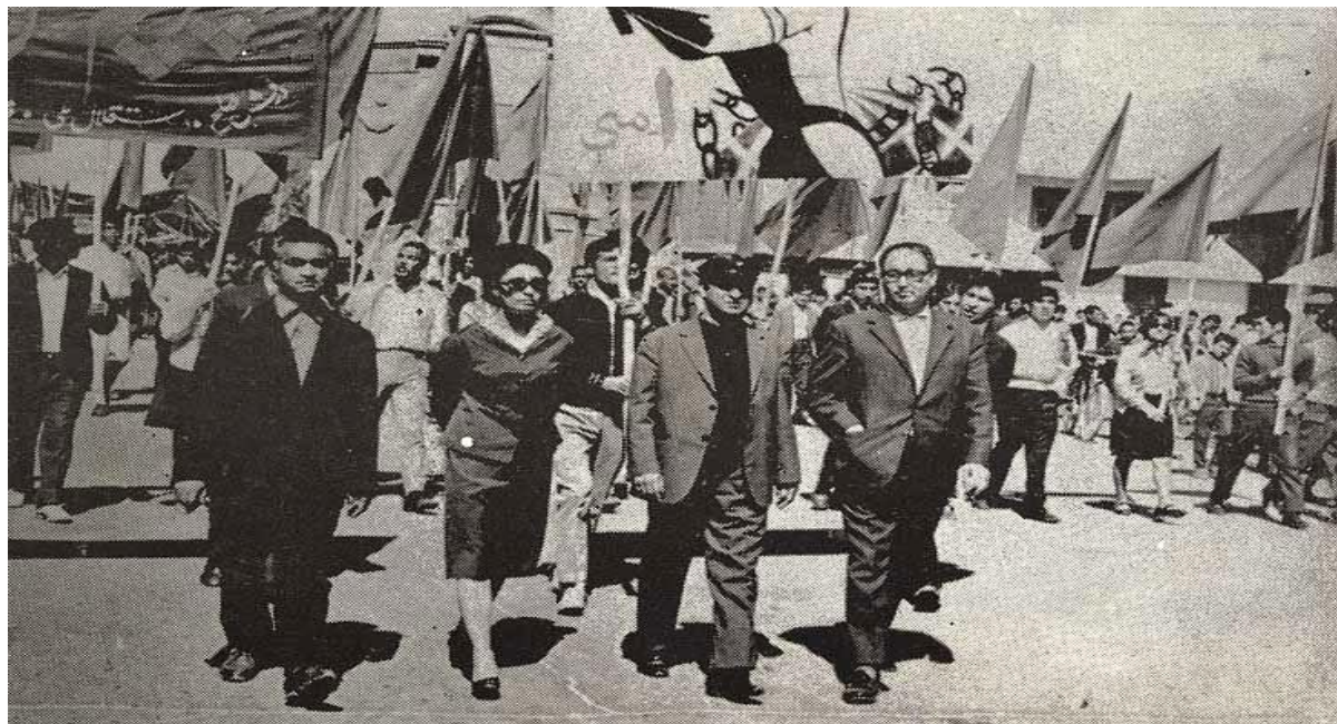
Кабул, 1969 г. Первомайская демонстрация левой оппозиции. В первом ряду (слева направо): М.А.Хайбар, А.Ратебзад, Б.Кармаль, С.А.Кештманд

С момента принятия конституции 1964 года и декларирования в ней права афганских граждан на создание политических партий и организаций начинается период бурной общественно–политической деятельности Б. Кармаля. Вместе с Н.М. Тараки и некоторыми другими лицами он явился одним из создателей Народно–демократической партии Афганистана. На ее 1 Учредительном съезде, состоявшемся 1 января 1965 года, он избирается заместителем секретаря ЦК партии. Ему было поручено съездом возглавить комиссию по разработке программы и устава НДПА. В следующем году подготовленная под его руководством программа партии была принята на пленуме ЦК и опубликована в первом (сдвоенном) номере газеты «Хальк». Весной 1967 года состоялось утверждение и устава НДПА. Б.Кармаль опубликовал в газете «Хальк» ряд статей, в которых обосновал необходимость создания в Афганистане легальной политической организации и раскрыл цели и задачи леводемократического движения.