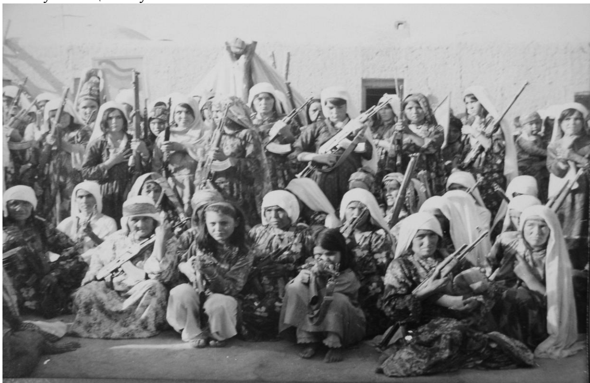
1985 г. Север Афганистана. Женский отряд самообороны деревни.

Создание массовых общественных организаций в рассматриваемое время происходило на фоне общего ухудшения военно-политической ситуации внутри и вокруг Афганистана. Состояние афганских вооруженных сил, полученных в наследство от прежнего режима, было мягко говоря, удручающим. Именно они при халькистском руководстве (1978–1979 гг.) больше всего пострадали среди прочих государственных институтов как в результате возросших боевых потерь, многочисленных чисток и перетрясок, [49] так и сопутствующего им массового дезертирства. К январю 1980 года численность афганской армии уменьшилась более, чем в три раза по сравнению с началом 1978 года. Оставшиеся предположительно 30–40 тыс. человек военнослужащих были деморализованы и практически утратили способность защищать государственную власть. Весьма безотрадным был и морально–психологический климат в армейской партийной организации. Хотя она к началу 1980 года насчитывала до 9 тыс. членов (т.е. более 40 % всего состава НДПА того времени) и номинально была представлена членами одной фракции – халькистов, однако на деле не была единой, распавшись на сторонников и непримиримых противников Х. Амина. Что касается общего положения на фронтах борьбы против антиправительственной вооруженной оппозиции, то последняя, как уже отмечалось, прочно удерживала в своих руках военно-стратегическую инициативу.