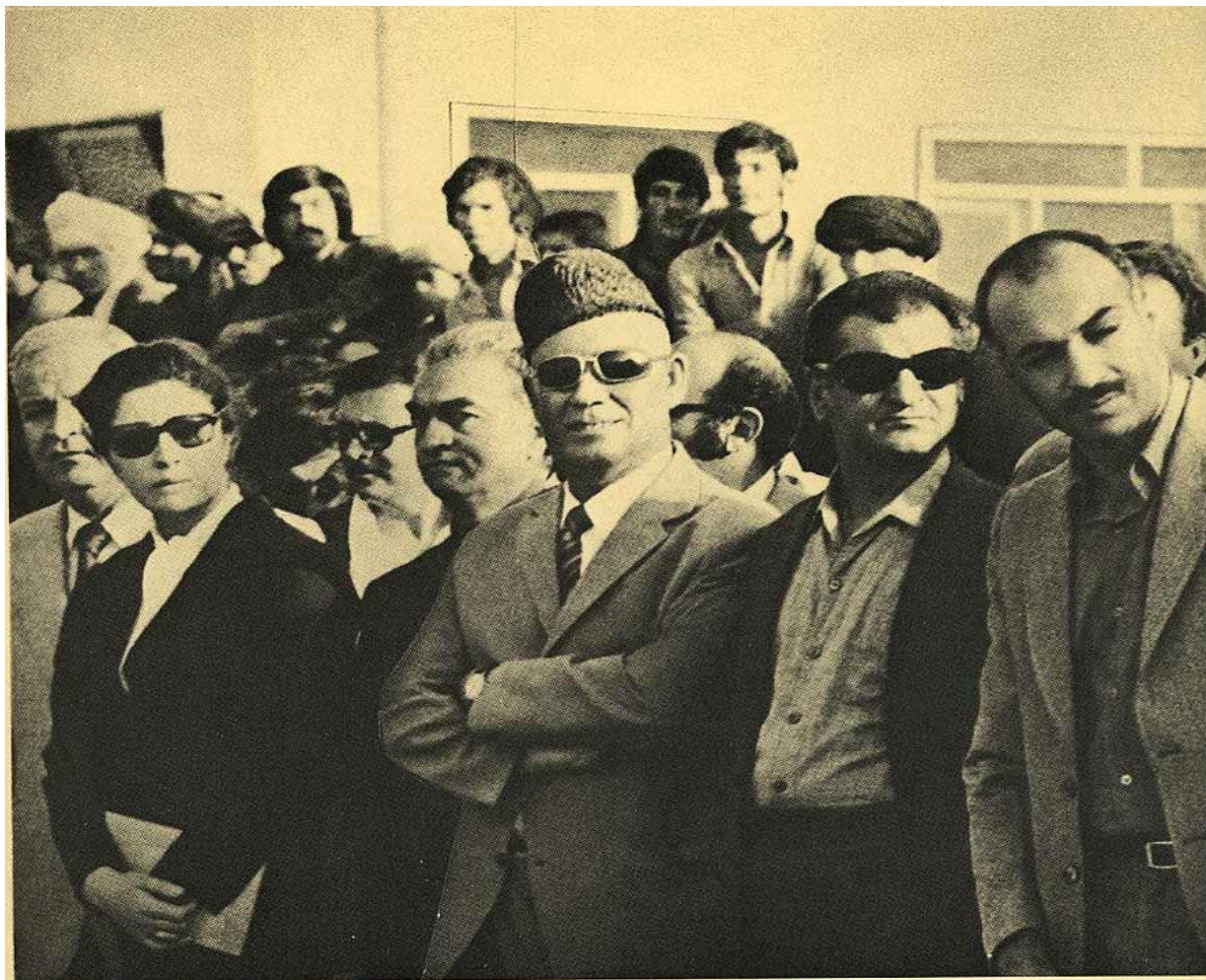
Кабул, июль 1977 г. Лидеры НДПА после объединительной конференции. Слева направо (в первом ряду): А.Ратевзад, М.А.Хайбар, Н.М.Тараки, Б.Кармаль.

С указанного времени и до начала мая 1986 года он являлся генеральным секретарем ЦК НДПА и председателем Революционного совета ДРА (до июня 1981 года был одновременно и главой правительства – премьер-министром). На его плечи, если иметь в виду бушевавшую в Афганистане гражданскую войну и расширявшееся день ото дня внешнее вмешательство во внутриафганские дела, легла огромная ответственность за судьбы страны и народа.