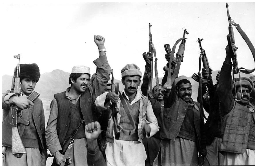
1988 г. Бойцы поста самообороны в уезде Момандара (провинция Нангархар).