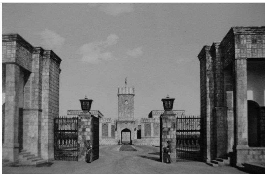
Кабул. Президентский дворец (парадный въезд).

В марте 1990 года против Наджибуллы был поднят мятеж, возглавленный халькистом, министром обороны Ш.Н. Танаем. Хотя президенту и удалось довольно—таки легко подавить выступление мятежников, однако с этого времени из его рук неумолимо стал уходить контроль над ситуацией на подвластной Кабулу территории. Ему не помогли ни его торопливые отречения от прошлого НДПА и, как он выражался, «навязанных ей чуждых теорий», ни категорическое осуждение им ввода советских войск в страну, ни реформирование правящей партии и создание в июне 1990 года вместо марксистски идеологизированной НДПА национально—патриотически и религиозно ориентированной Партии Отечества, председателем которой он был избран.