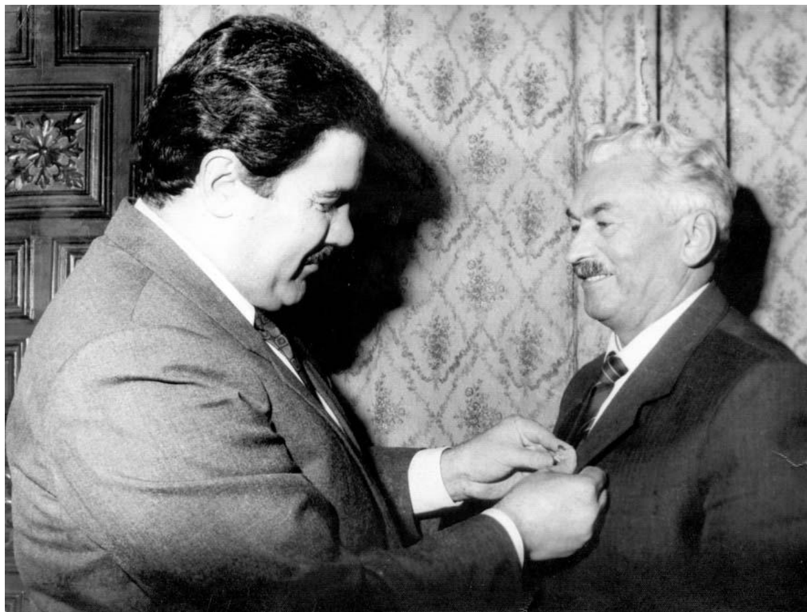
Дворец «Гольхана», июль 1988 г. Прием президентом РА группы советских советников в связи с их отъездом на родину. Слева направо: М.Наджибулла и М.Ф.Слинкин.

Еще одним событием по либерализации левого кабульского режима явилось назначение в мае этого года премьер–министром Афганистана беспартийного Мухаммада Хасана Шарка, известного в прошлом политического деятеля, бывшего первого заместителя премьер–министра при республиканском правительстве М. Дауда [65]. В его правительство, состоявшее из 31 министра, вошли, наряду со членами НДПА, 18 беспартийных и представителей других политических и общественных организаций. Новый кабинет объявил важнейшими задачами своей деятельности защиту национального единства, территориальной целостности страны и прекращение братоубийственной войны через национальное примирение.