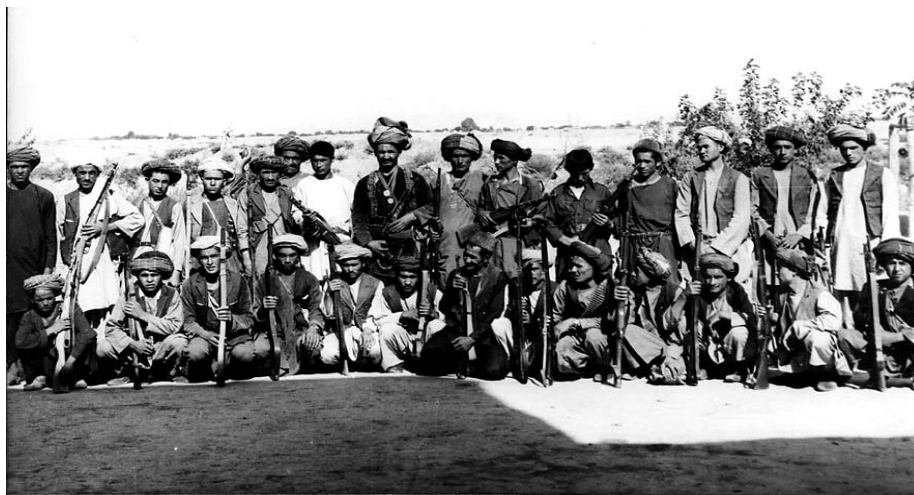
Провинция Пактия. Отряд территориальных правительственных войск (малиши).

распространении ими пленок с записями бурных дебатов на этих конференциях; направлении протестных писем в адрес ООН; распространении упадочнических, пораженческих настроений и паникерских слухов; в массовых выступлениях сторонников Б. Кармаля, состоявшихся в Кабуле в преддверии Общепартийной конференции и т.д. [51].