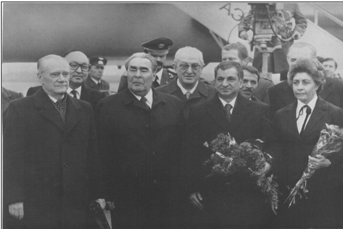
Октябрь 1980 г. Встреча на аэродроме в Москве афганской партийно-правительственной делегации. В первом ряду (слева направо): Н.А. Тихонов, Л.И. Брежнев, Б. Кармаль и А. Ратебзад. Во втором ряду: С.А. Кештманд, Ю.В. Андропов, С.М. Зерай.