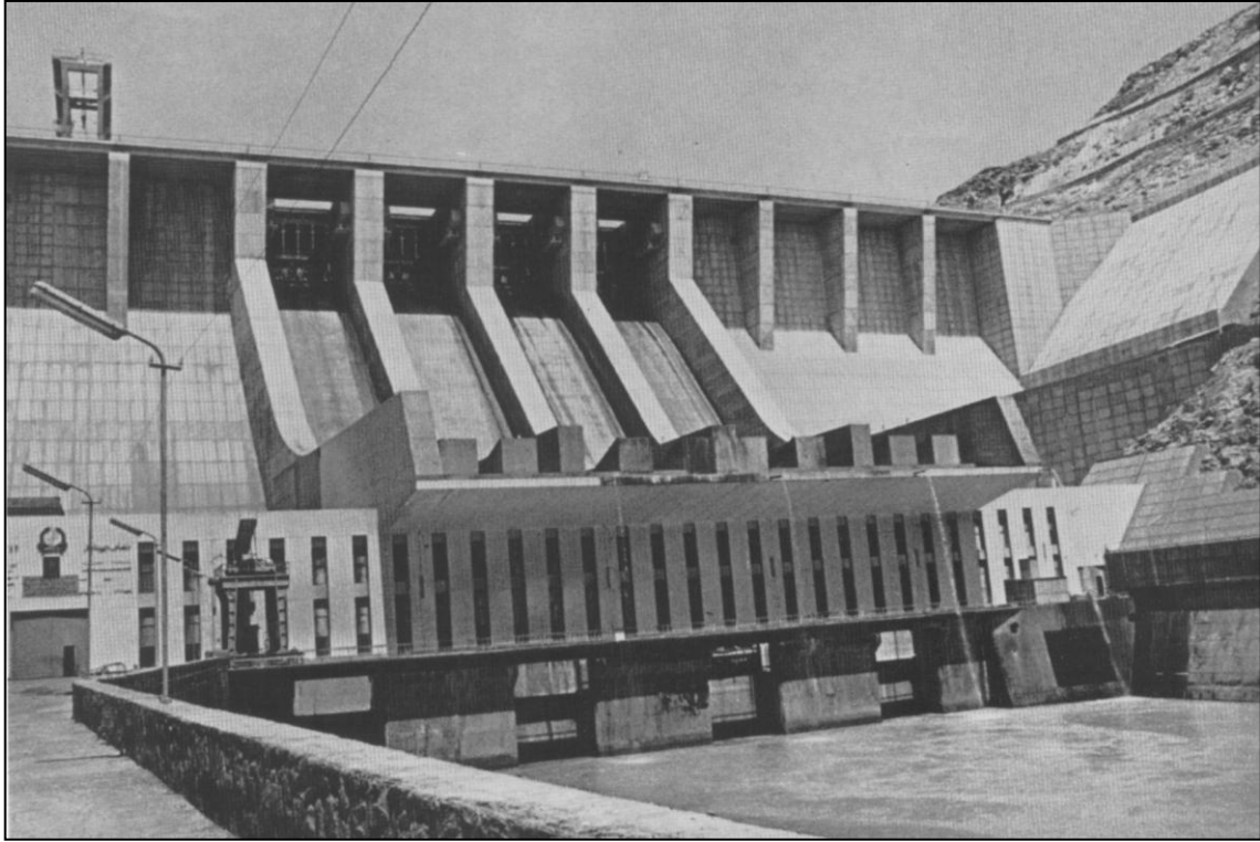
Гидроэлектростанция Наглу – крупнейшая в Афганистане. Построена при экономическом и техническом содействии СССР.