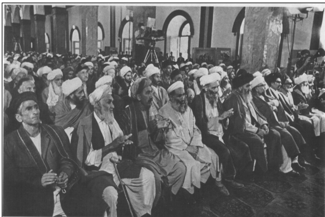
Июль 1980 г. Кабул. Первая в истории Афганистана конференция улемов и духовенства.