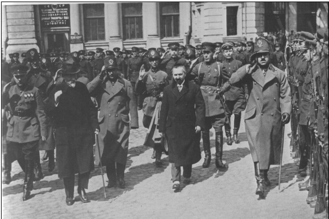
1928 г. Приезд в Москву афганского короля Аманулли-хана. В группе сопровождающих К.Е. Ворошилов и М.И. Калинин.