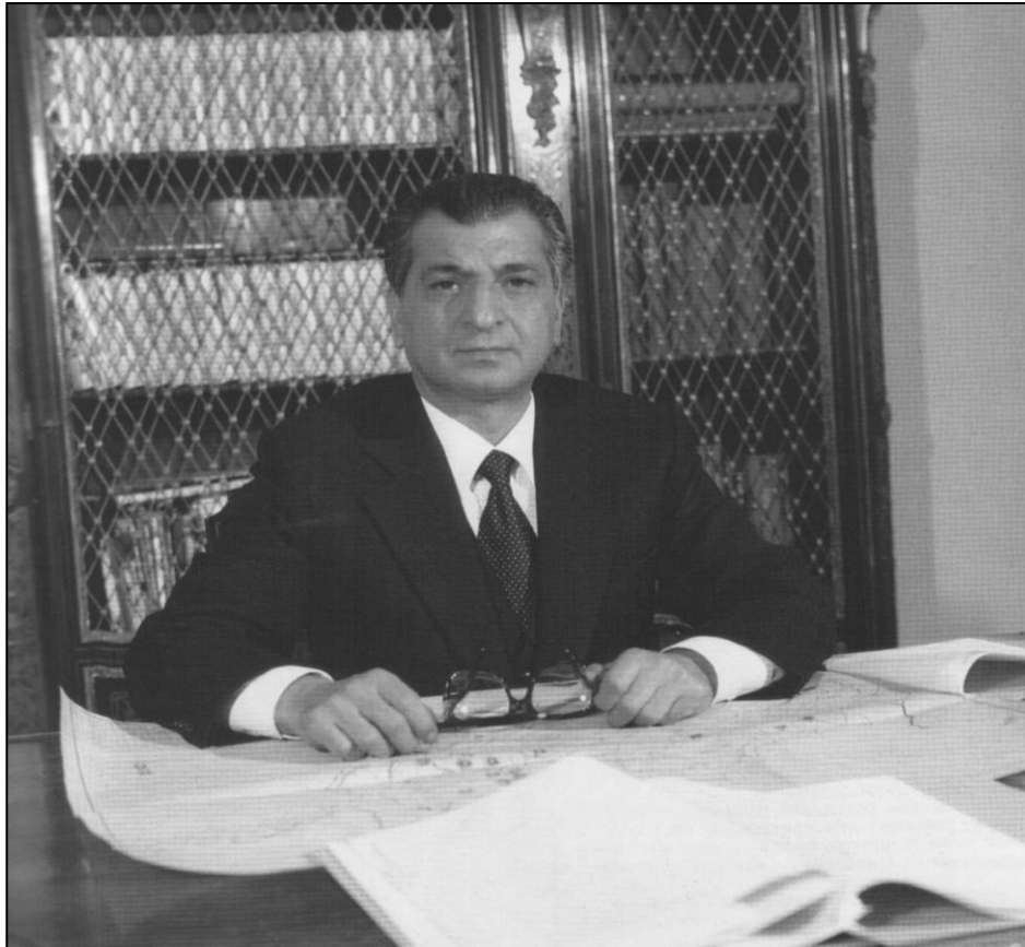
1981 г. Генеральный секретарь ЦК НДПА, председатель Революционного совета ДРА Бабрак Кармаль.