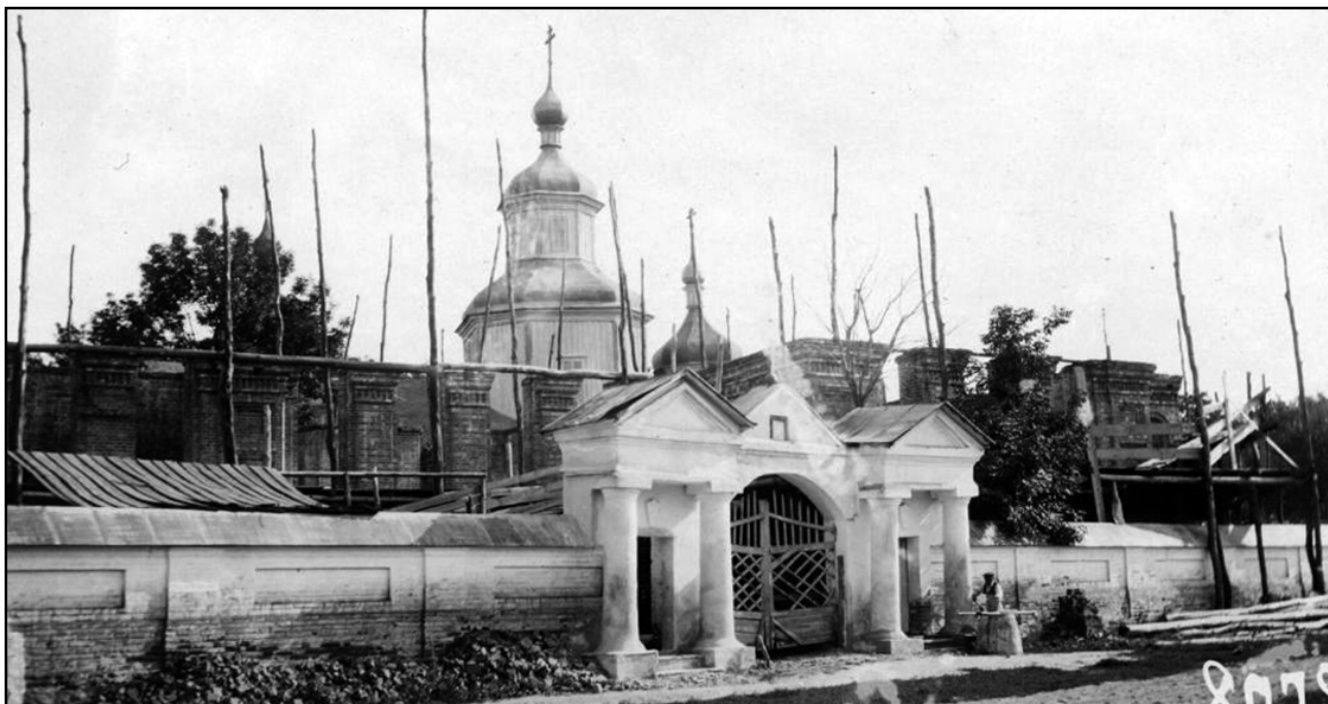
Будівництво нової Вознесенської церкви. Вигляд з південного заходу

нижнеетажної и верхнеетажної церквей» [6, 16].