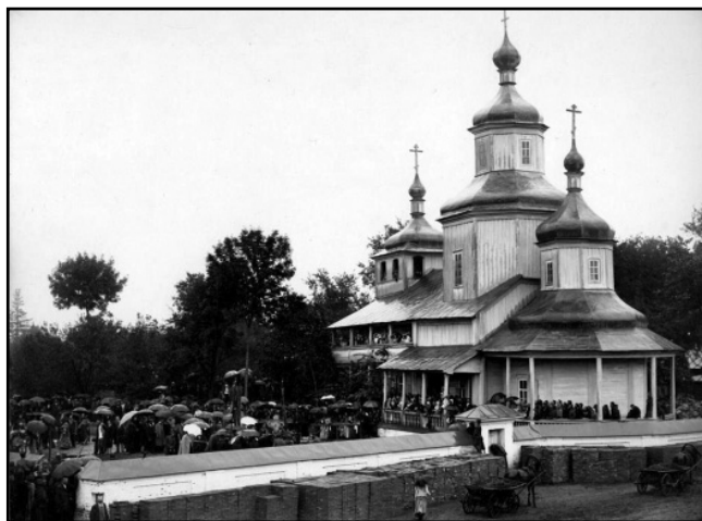
Дерев'яна Вознесенська церква

З приведеного уривка літописного тексту неможливо зрозуміти, якою була ця Вознесенська церква – кам'яною чи дерев'яною. Наступного разу ми зустрічаємо її ім'я в списку храмів Павла Алеппського (1654). Важко сказати, чи мали ці два храми XII і XVII ст. щось спільне, окрім