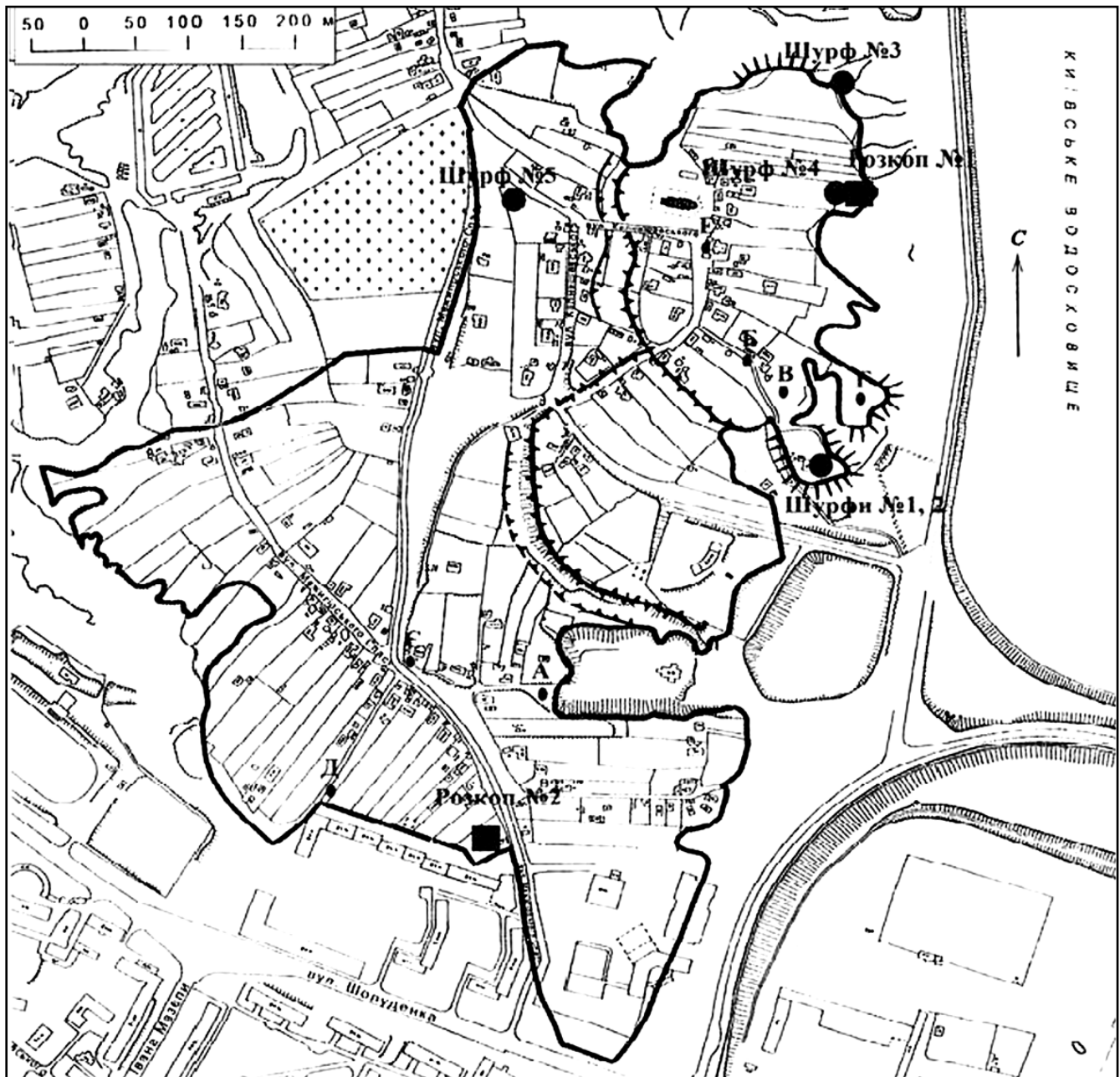
Рис. 1. Загальна схема археологічних робіт на території Вишгородського історико-культурного заповідника у 2012 р.

Підйомний матеріал можна поділити на три періоди: