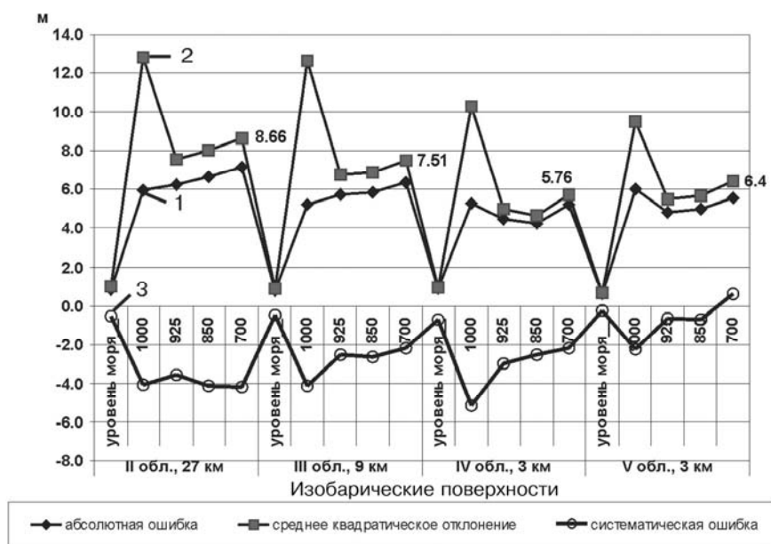
Рис. 3. Сравнительная оценка статистических параметров прогноза давления (геопотенциала) в зависимости от шага сетки.

слое наблюдаются для случаев с малоградиентными полями давления и антициклональным барическим полем (классы 1, 6 - 8). Абсолютная ошибка прогноза температуры для указанных классов не превышает 2^{\circ}\text{C} , что соответствует 100 % оправдываемости прогнозов. Относительная ошибка прогноза температуры на уровнях выше 1000 гПа изменяется в среднем от 0,4 до 0,7. Относительная ошибка прогноза для приземной температуры воздуха значительно выше и меняется от 0,8 до 1 и выше. Это объясняется тем, что в инсталлированном варианте модели MM5 в ИПБ АЭС не подключена модель LSM (Land Surface Model), которая обеспечивает параметризацию процессов приземного слоя атмосферы и суточные изменения температуры и энергии турбулентности.