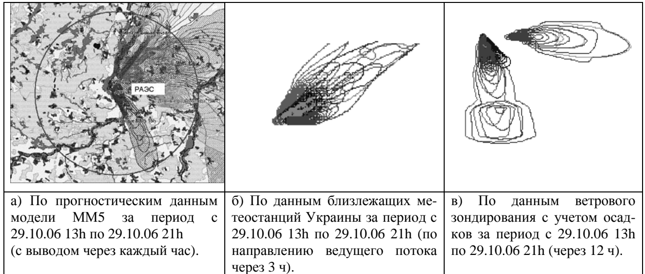
Рис. 4. Сравнительная характеристика расчетов направлений выброса при разных метеоданных

Расчеты были проведены для нестационарных условий – выход и прохождение циклона по территории Украины с СЗ на ЮВ. Метеорологическая информация численного прогноза погоды – 3-мерные поля ветра, температуры, геопотенциала и осадков были препроцессированы в характеристики турбулентности пограничного слоя атмосферы и использованы в модели атмосферного переноса.