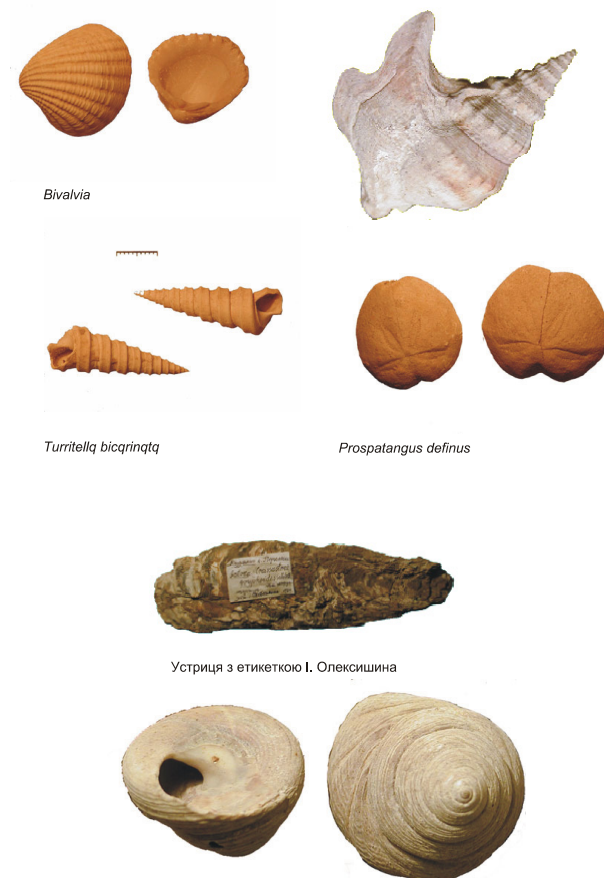
Рис. 1. Зразки фауни з колекції І. Олексина.

Займатися наукою Іван Олексин розпочав студентом Університету, потім продовжив як асистент професора Войцеха Рогалі, який очолював Геологічний інститут Львівського університету. Перші наукові праці — це результати самостійних досліджень на теренах Поділля: „Звіт про геологічну екскурсію під час літніх канікул 1927 року північніше Теревовлі вздовж Серету до Тернополя і на північ від Теревовлі вздовж рі-