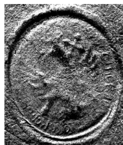
Печатка Чернігівського полку

1. Дашкевич Я. Гетьманська Україна: полки, полковники, сотні Лівобережжя //Пам'ятки України. – 1990. – № 2. – С. 11–13; № 3. – С. 18–20. Названий устрій не був специфічним винаходом українців. Ще у IV ст. так була організована орда Жужань (зараз це територія Монголії). Л. Гумильов писав: «Єдиницею, боевою і адміністративною, считался полк в тисячу человек. Полк подчинявся предводителю, назначенному ханом. В полку было десять знамен по сто человек; каждое знамя имело своего начальника» (Гумилев Л. Древние тюрки. – М., 1993. – С. 12). Звичайно, що треба робити кореляцію на суспільний прогрес. На відміну від кочівників, українці були письменні і для рахунку використовували досконаліші прилади, аніж овечі кізьяки. Самі умови буття, в яких опинилися українці в цей час, покликали таку організацію суспільства, бо під загрозою фізичного і духовного знищення був увесь етнос. Слушною виглядає й наступна думка: «Цю політико-адміністративну систему іноді вважають козацьким новотвором, але такий погляд не видається незаперечним: територіяльні поділи багатьох середньовічних держав зважали на потреби оперативної мобілізації збройного люду. Не були тут винятком і повіти та воеводства Великого князівства Литовсь-