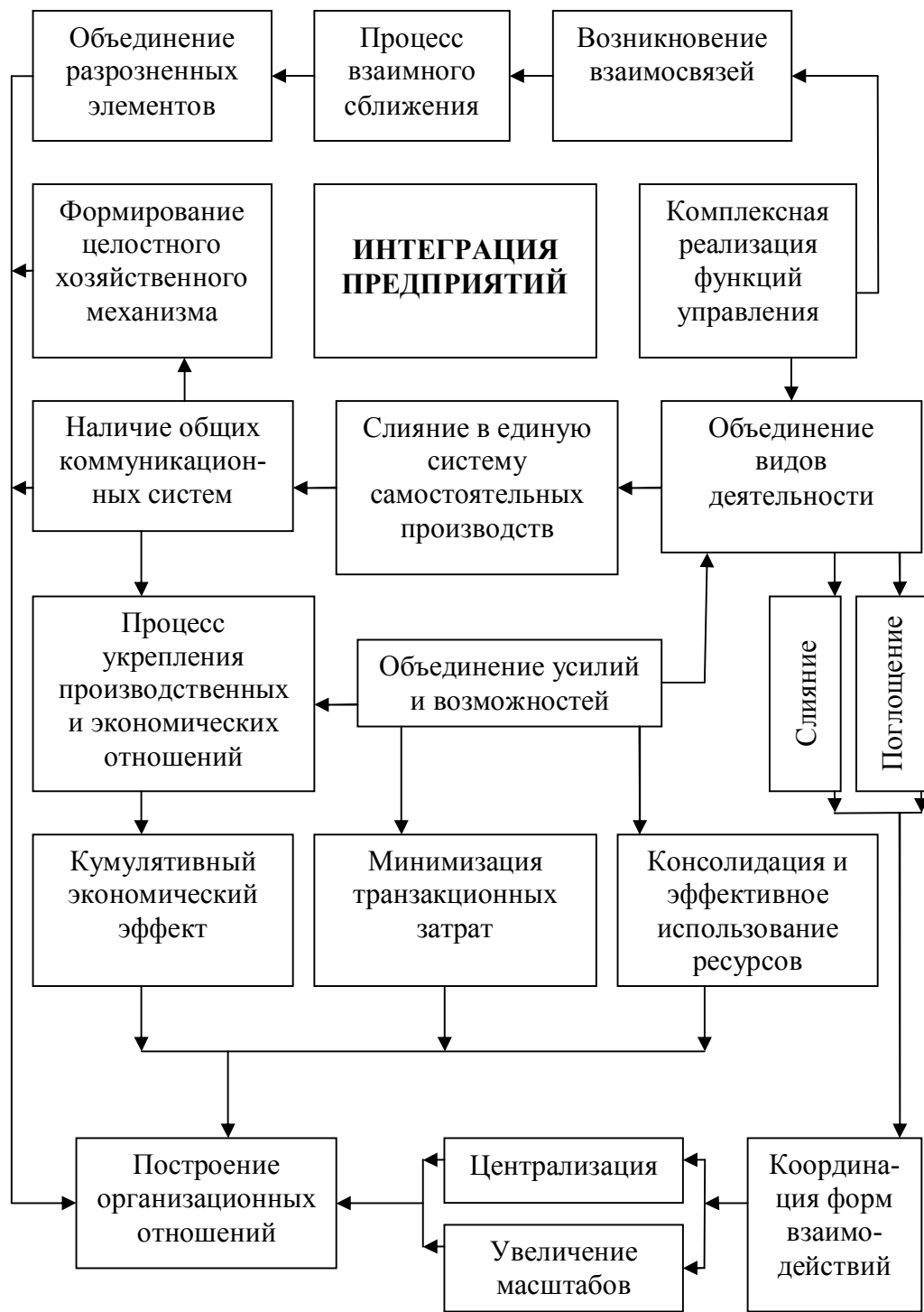
Рис. 1. Подходы и условия образования интеграционных объединений