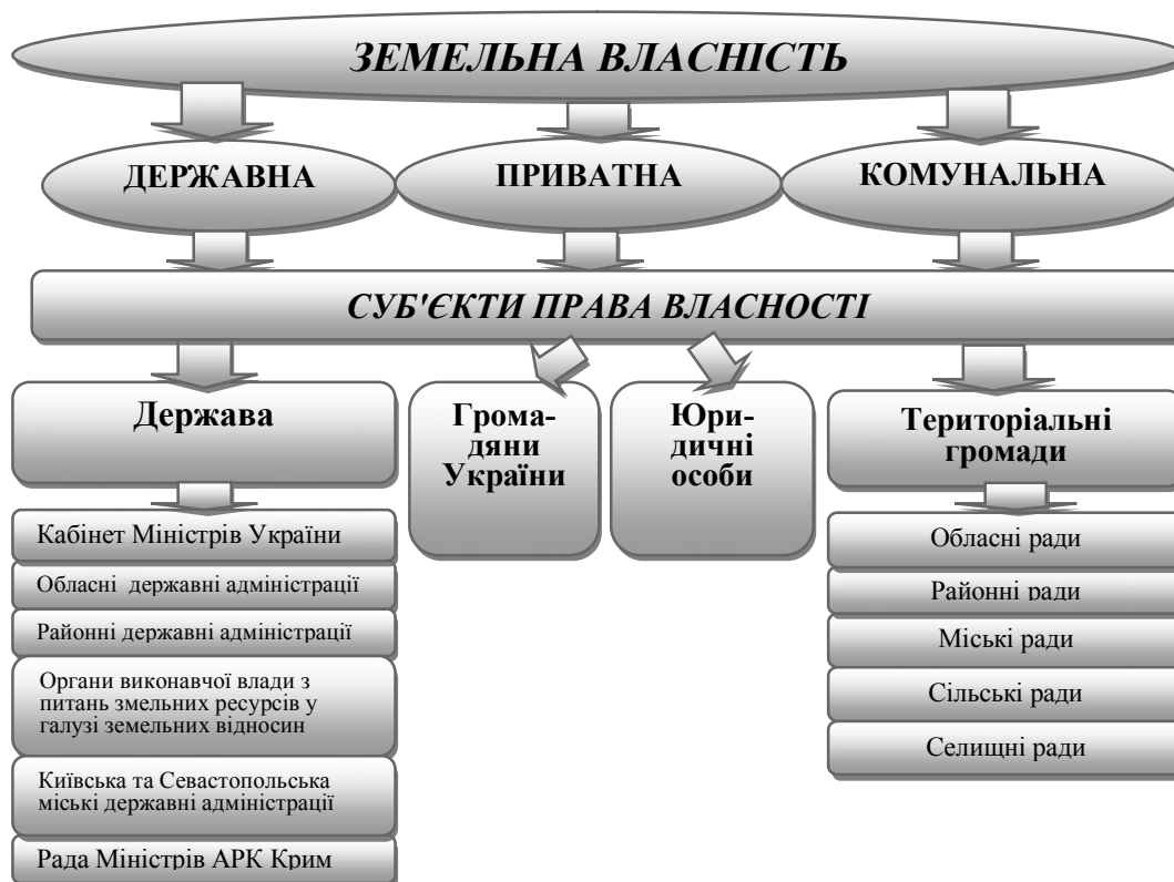
Рис.1 Перелік суб'єктів прав власності наземлю

Існують певні обмеження щодо приватизації земель. Так, відповідно до ст. 83, 84 Земельного кодексу України: