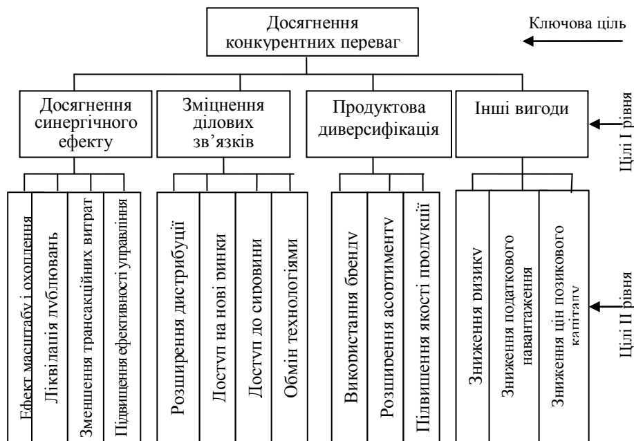
Рис. 1. Дерево цілей інтеграції підприємств

Таким чином, головна ідея інтеграції – це перш за все досягнення сукупної користі, яка в ринковій системі господарювання досягається за рахунок збільшення конкурентних переваг.