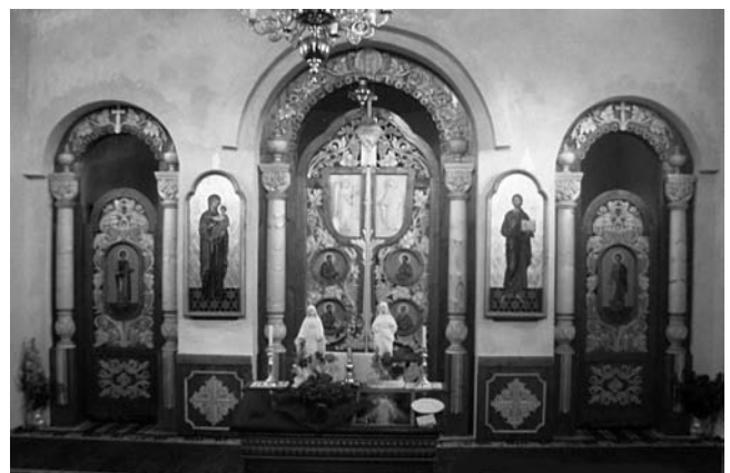
Іл. 1. С.Д.Стефурак. Іконостас церкви Божого милосердя. Село Слобідка, Косівський р-н.

використано ті основні символічні елементи декору, присутність яких на іконостасі обов'язкова; органічна єдність з іконами, використаними в оздобі храму.