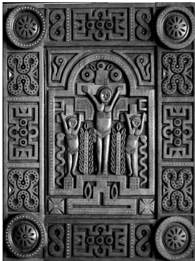
Іл. 4. Д.Ф.Шкрібляк. Ікона. 1996 р.

обробки дерева Гуцульщини. Захоплює культура технічного виконання усіх конструктивних частин та тактовне декорування, що дозволило створити єдиний стилістичний сакральний образ 2 .