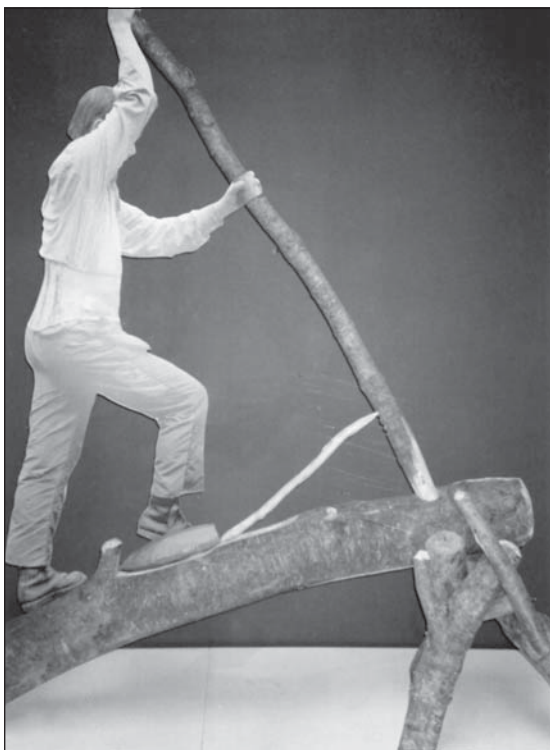
Фото 5. Моделювання процесу сколювання довгих пластин (м. Орлеан, Франція)

посуд, вироби зі середземноморських мушель Spondilus та довгі пластини.