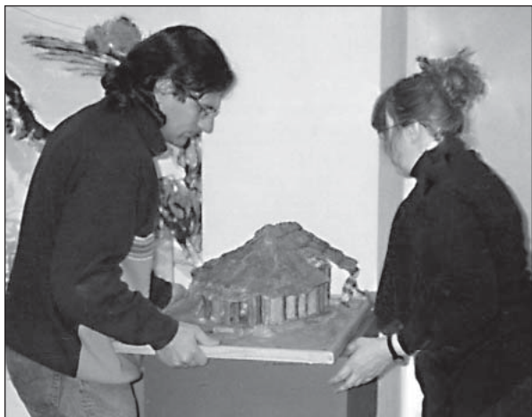
Фото 1. Модель житла варненської культури (Болгарія)

Збаражський музей (Україна), де зберігаються матеріали поселення Бодаки, представив на виставці не лише вироби з кременю, а й чудовий посуд із розписом, виготовлений мешканцями цього поселення. На виставці експонувалася модель трипільського житла з Росохуватки (Україна) (фото 4), яка, на думку дослідників, відбиває конструкцію жител Бодакського поселення.