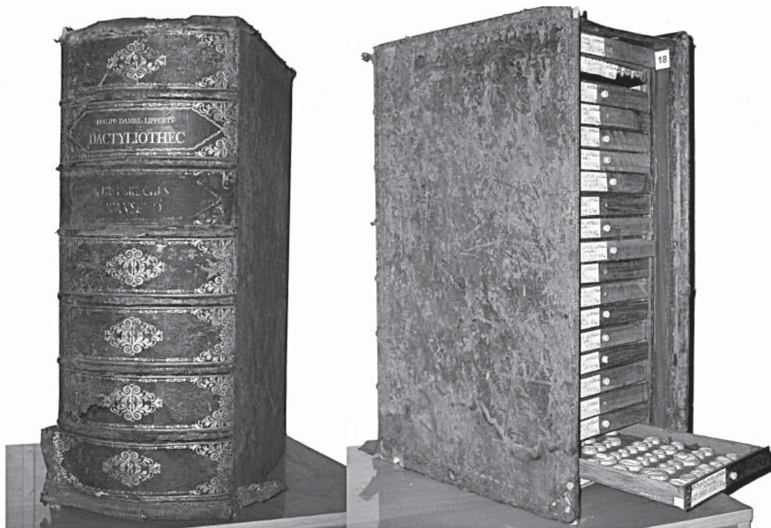
Рис. 3. Висувні шухлядки з відбитками камей