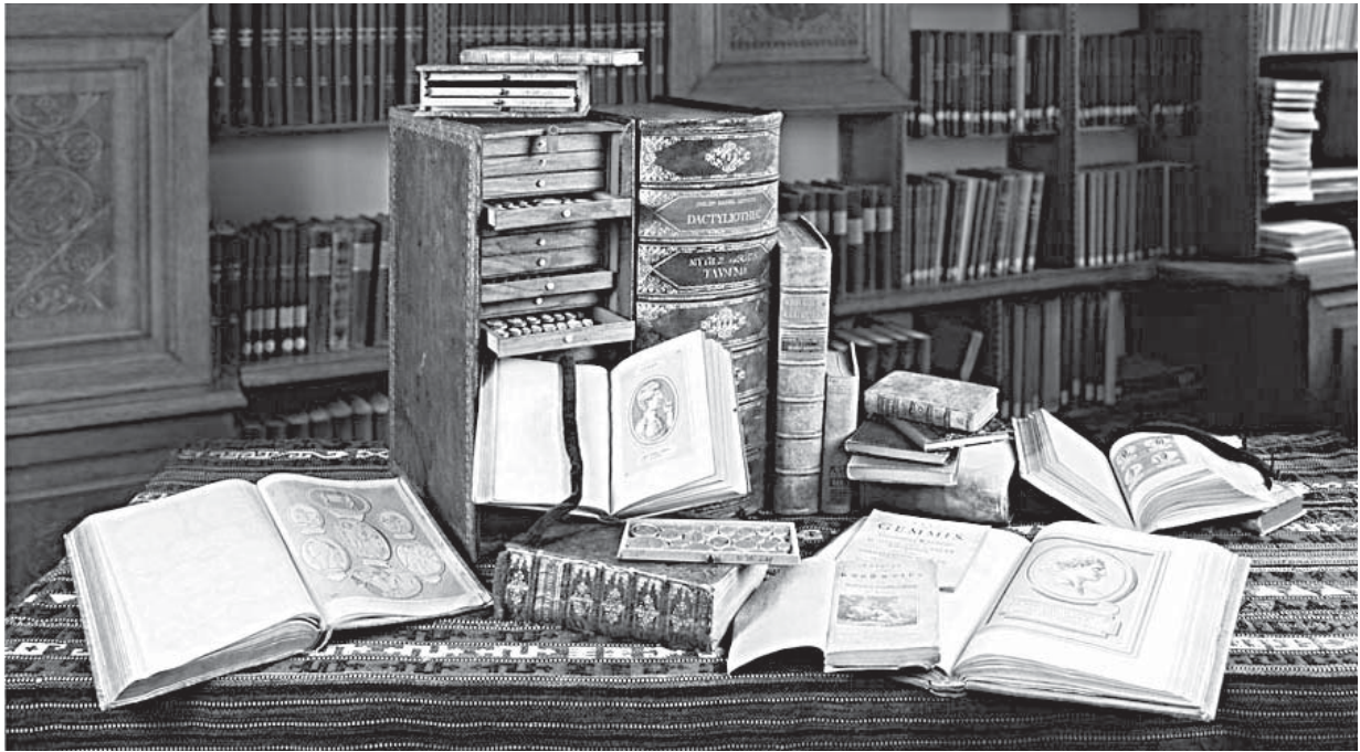
Рис. 4. Зібрання відбитків камей XVIII—XIX ст. У центрі — «Дактиліотека» Ф.Д. Ліпперта. Аугсбург (Німеччина)

дерева — дуб, горіх, липу. Ручки на шухлядках вироблено зі слонової кістки у вигляді круглого стрижня з дископодібним потовщенням у середній частині з круглою пласкою голівкою. На корінці книги розташовано напис: «PHILIPP DANIEL LIPPERTS DACTYLIOTHEC», під ним другий, що визначав тисячу: «HISTORISCHES TAUSEND» (історична тисяча). На інших томах були написи: «MYTHOLOGISCHES TAUSEND» (міфологічна тисяча), «EIN SUPPLEMENT» (доповнення) (Schatzkästchen ... 1989, S. 148—149).