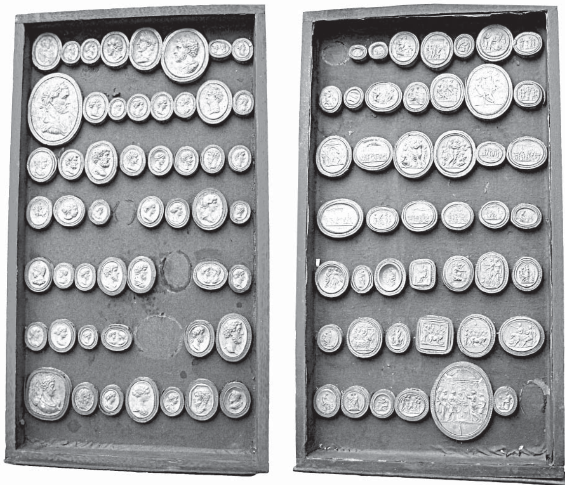
Рис. 2. Ящик-книга із зібранням відбитків камей ( колекція НМІУ)