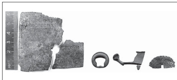
Рис. 1. Уламки бронзової таблички диплома разом із супутнім археологічним матеріалом

Очевидно, військовий диплом отримував кожен солдат, який служив у допоміжних підрозділах римської армії, а також у міських і преторіанських когортах та дослужився до почесної відставки. Можливо, отримання дипломів не було автоматичним, їх замовляли (та оплачували) ветерани, які їх потребували (пор.: Roxan 1986, р. 265—266). Після виходу у відставку ветерани допоміжних підрозділів отримували два важливі права: римського громадянства, якого вони, як правило, не мали (до 212 р., коли Constitutio Antoniniana дарувала його всім жителям імперії), і conubium , тобто законного шлюбу (в тому числі з жінками, які не мали римського громадянства: істотний привілей, оскільки шлюб між громадянами й негромадянами законним не визнавали), якого римські солдати під час служби були позбавлені (про заборону шлюбу для військовослужбовців див.: Jung 1982, р. 302—346; Behrends 1986, р. 150—166; Pferdehirt 2002, р. 204—214). Щодо преторіанців, то вони не потребували римського громадянства, оскільки преторіанські когорти завжди набирали з римських громадян.