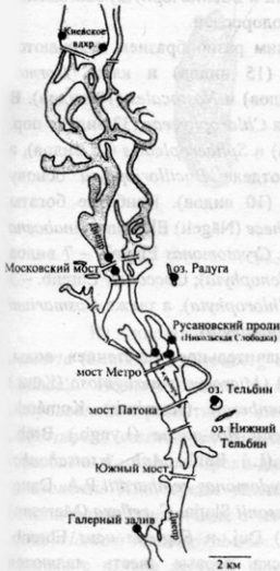
Рис. 1. Карта района исследований. Точками обозначены пункты отбора проб.

perfoliatus L.), а также водоросли-макрофиты из отделов Chlorophyta и Streptophyta . Температура воды 24–26 °С.