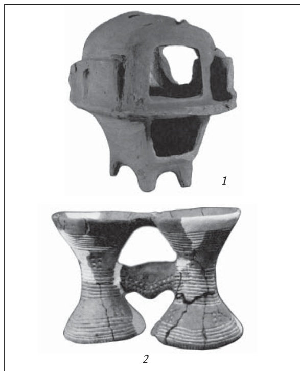
Рис. 2. Глиняні вироби трипільської культури: 1 — моделька, с. Розсохуватка; 2 — біноклеподібна посудина, с. Шкарівка

Для чого призначалася моделька? Модельки будинків відомі не тільки в трипільській, але й інших синхронних з нею та пізніших археологічних культурах з обрядом трупоспалення, де вони слугували поховальними урнами (осуарія-