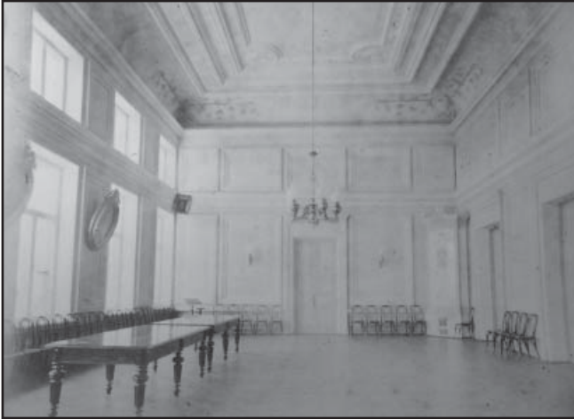
Урочиста зала жіночої гімназії. Фото кінця XIX ст.

І.Ф.Висоцький у своєму звіті про стан гімназії у 1896 навчальному році детально описував внутрішнє планування закладу «В обширном двухэтажном здании этом, роскошно отделаном, имеются: прекрасный в два света торжественный зал, десять классных комнат, отдельные помещения для физического кабинета, библиотеки, канцелярии, кабинет начальницы, отдельные комнаты для собрания учителей и учительниц, обширные во всю длину здания коридоры в верхнем и нижнем этажах, отдельные помещения для одежды воспитанниц старшего и младшего возрастов и роскошная лестница. Все эти помещения высоки, очень хорошо освещены и снабжены необходимыми приспособлениями для хорошего отопления и постоянного обновления воздуха, а трудами и заботами Попечительного Совета вполне достаточно обставлены необходимыми предметами мебели и освещения» [2, 18]. Він висловлював подяку благодійникам Миколі Артеміювичу та його дружині Пелагеї Георгіївні за щорічні пожертви, завдяки яким гімназія була забезпечена новими меблями, навчально-допоміжними колекціями та посібниками, мала фундаментальну та учнівську бібліотеку, фізичний кабінет та кабінет природничих наук.