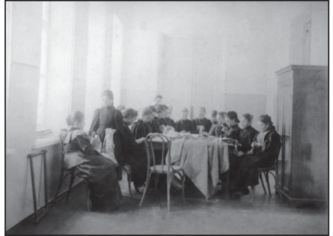
Навчання рукоділлю у класній кімнаті. Фото кінця XIX ст.

Своєзахоплення глухівською жіночою гімназією висловлював викладач російської словесності цього закладу П.А. Адамов: «... женское образование