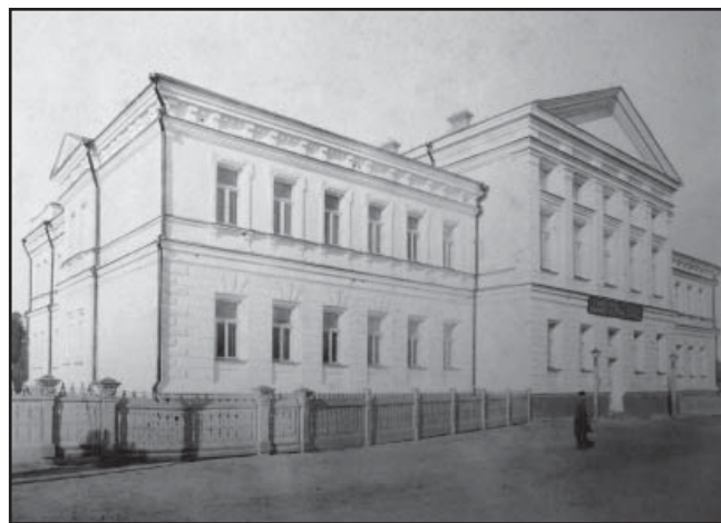
Будинок жіночої гімназії. Фото кінця XIX ст.

Секретар педагогічної ради жіночої гімназії