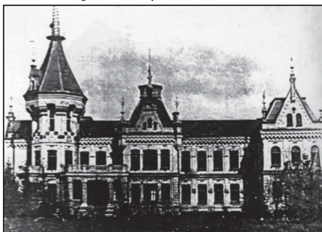
Рис. 2. Усадебный дом Кульбакинского имения в Александровском лесу. Нач. XX в.

поколения – предприимчивыми и талантливыми хозяйственниками. Их имения отличались высокой организацией свеклосахарного производства, применением новых способов возделывания земли, содержанием чистокровных пород скота, разведением садов и парков, и мн. др. Теткинское и Глушковское имения можно отнести к «крупнейшим владениям, имеющим от 5000 десятин и более» [1, 364]. Волфинское и Кульбакинское имения относятся к «образцовым усадебным хозяйствам Курской губернии конца XIX в. – начала XX в. [1, 364].