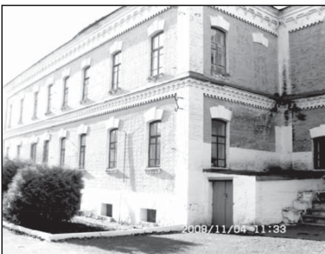
Рис. 7. Поварская Кульбакинского имения, 2008