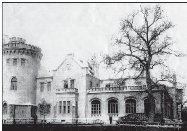
Рис. 1. Усадебный дом Волфинского имения в Александровском лесу. Нач. XX в.

Изучение стилистических форм и особенностей усадебного комплекса Глушковского района в конце XIX в. – начале XX в. позволило увидеть, насколько хозяева были современны в своем выборе. Оставшиеся дома – украшение русской глубинки как и конца XIX в., так и настоящего времени. Во второй половине XIX века Глушковское и Теткинское имения перешли к самому богатому монополисту юга России – сахарозаводчику Артемию Яковлевичу Терещенко. Сначала он брал земли в аренду, а затем постепенно скупал их у крупных и мелких помещиков. Теткинское имение унаследовал старший сын Никола Артемьевич, Глушковское – младший сын Семен Артемьевич. К началу XX в. семья Терещенко владела землями, располагавшимися на территориях Теткинской, Коровяковской, Глушковской, Кобыльской, Кульбакинской волостей Рыльского уезда Курской губернии (табл. 1). Они были людьми нового