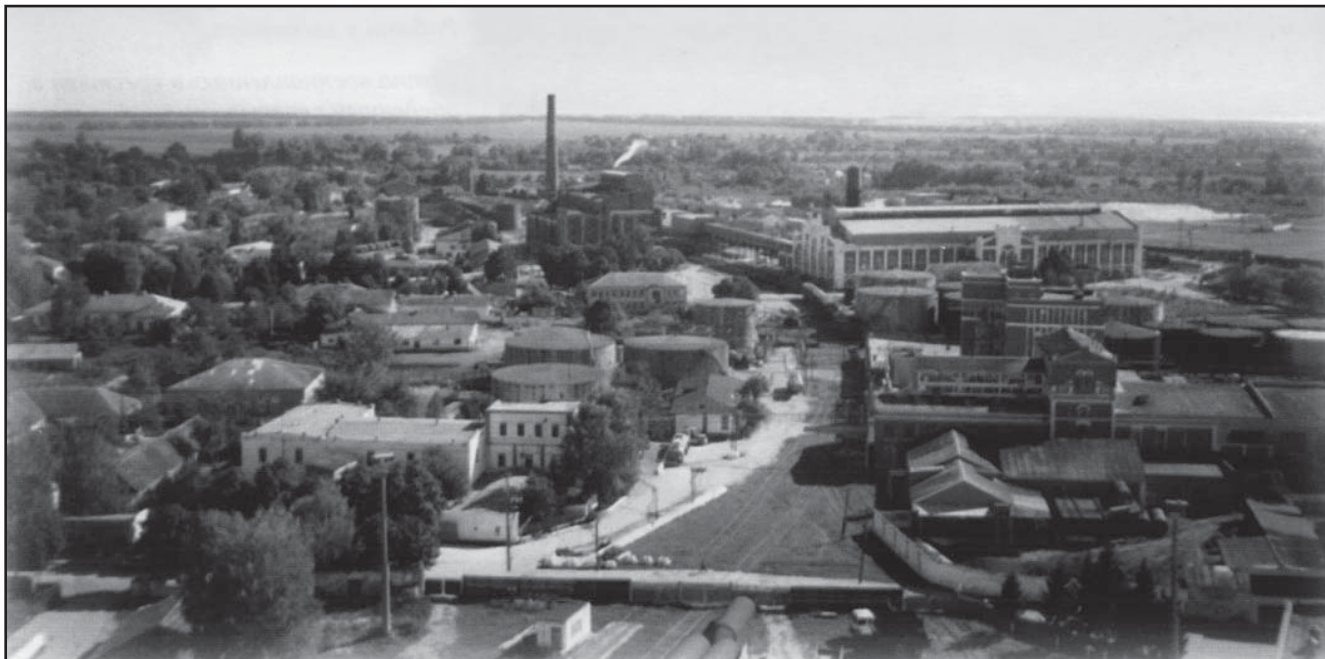
Рис. 3. Промышленная зона пос. Теткино, 2005

распределение на территории имения получили почвы черноземного типа, некоторый процент занимали лугово-черноземные. По механическому составу почвы в основном среднесуглинистые. В пределах имения были найдены залежи глины, пригодной для производства кирпича.