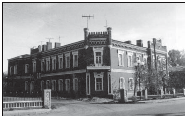
Рис. 4. Дом управляющего Глушковской суконной фабрики (в н. в. жилой дом), 2008

Вокруг дома был посажен парк. В его парадной части были разбиты клумбы, дорожки, вдоль которых стояли небольшие скульптуры, выстроен фонтан, каменный грот. В парке росли липы, грабы, ясени, дубы, клены, каштаны, ели, сосны, лиственницы,